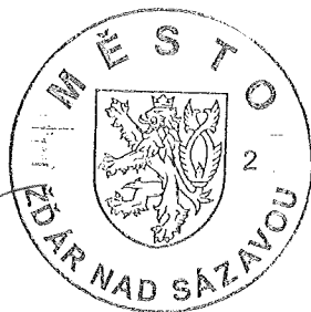
Ing. Dagmar Zvěřinová starostka města Žďáru nad Sázavou