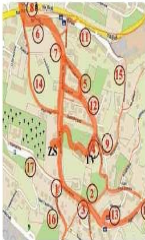
Mapa s nebezpečnými místy – ZŠ Na Perštýně, Liberec (program Na zelenou, Nadace Partnerství, 2007)