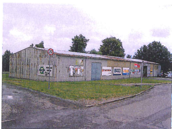
celkový pohled na sklad ze severozápadu