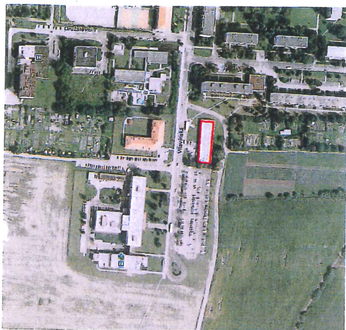
letecký snímek lokality s vyznačením skladu