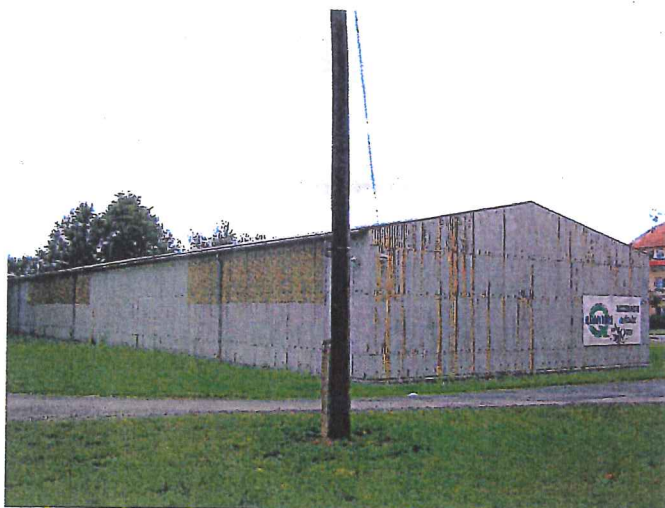
celkový pohled na sklad ze severovýchodu