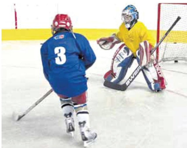
Mladí Češi a Finové se budou společně zdokonalovat v hokejových dovednostech.

Myšlenka uspořádat česko-finskou hokejovou školu se zrodila zhruba před dvěma lety. „Nejdůležitější a nejnáročnější částí ale bylo, jak projekt zafinancovat. Kdyby nebylo kraje Vysočina, prostředky bychom dávali dohromady jen těžko. Jsem vděčný kraji Vysočina, protože se stal základním stavebním kamenem, na který se nabalovali další sponzoři, kteří nám pomohli rozpočet, dosahující téměř 700 tisíc