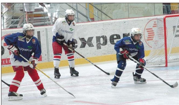
MLADÍ HOKEJISTÉ z Finska a z Vysočiny věnovali první trénink zdokonalování bruslení.

Z Finska, z regionu Hämeen, přijelo dvaadvacet hráčů, z toho dvě dívky. „Původně měl být počet hráčů z Vysočiny a Finska stejný - třiačtyřicet, ale jeden