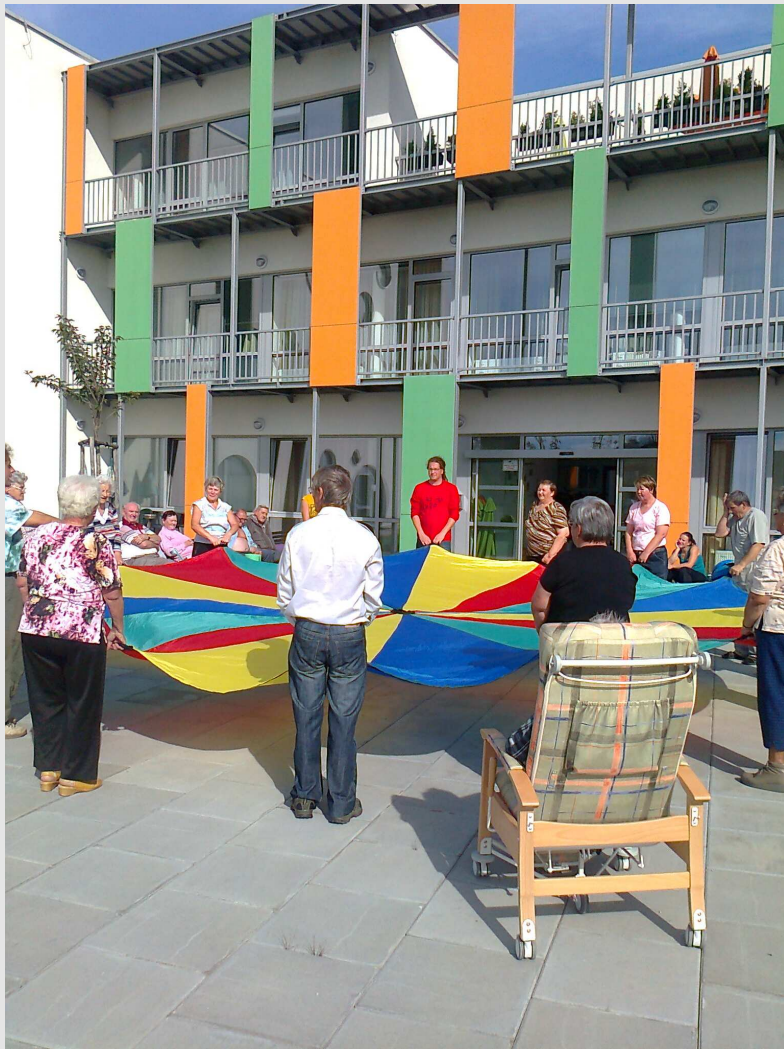
Cvičení seniorů s padákem