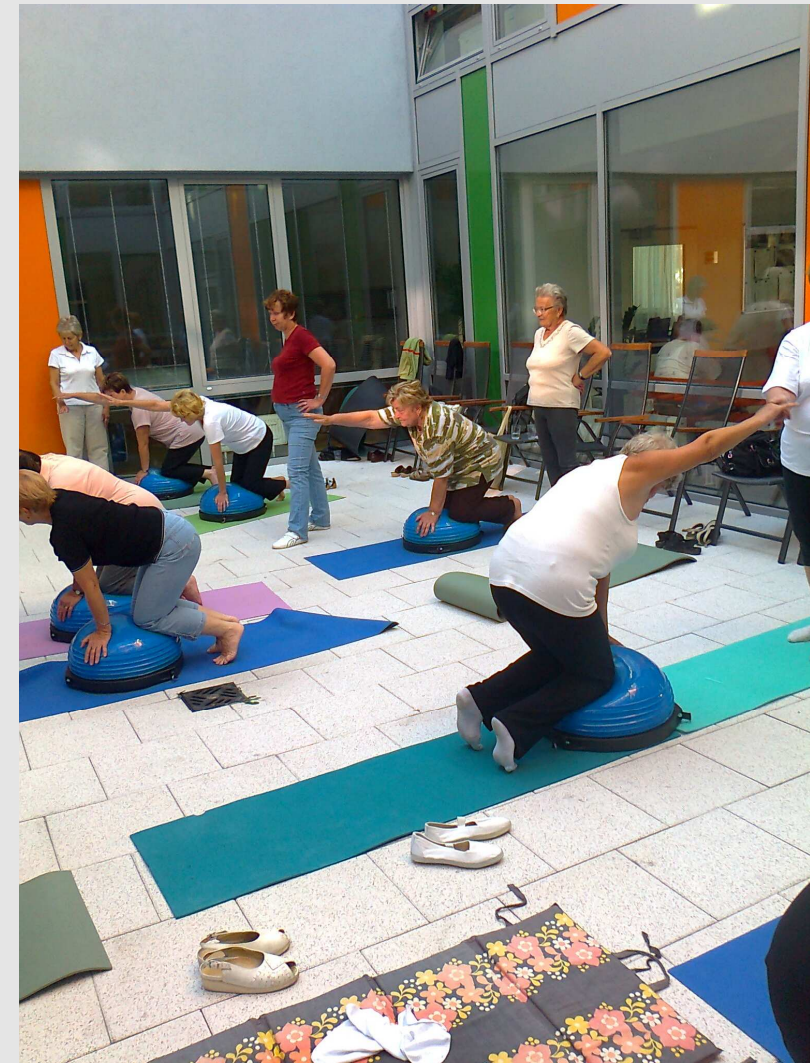
Cvičení seniorů s míčem bossu