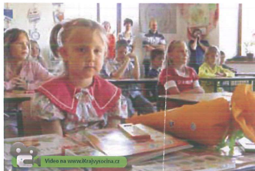
Ve středu 1. září usednou do školních lavic na Vysočině noví prvníčky