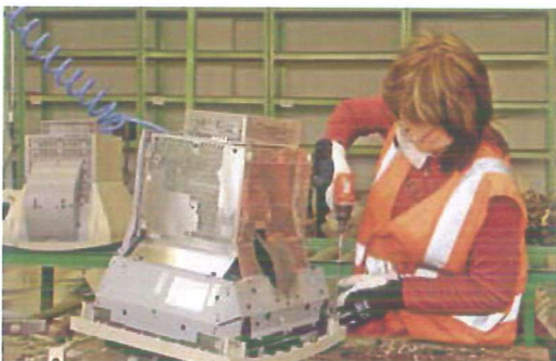
Například demontáž počítačového monitoru trvá zkušenému „likvidátorovi“ několik desítek minut. Téměř vše se díky demontáži podaří vytrítit

Jedná se o projekt propojení existujících odpadových systémů měst a obcí