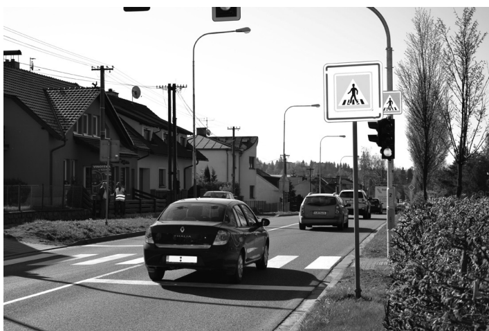
Inteligentní semafony ve Žďáře nad Sázavou

Žďár nad Sázavou, ulice Bezručova, silnice I/37