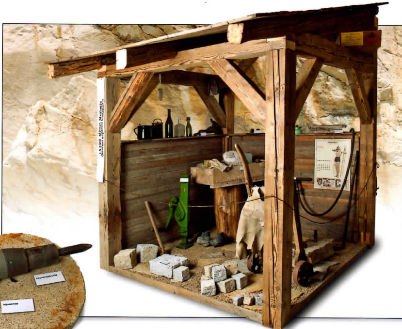
MRÁKOTÍN – Kamenictví