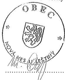
starosta obce Nová Ves u Leštiny