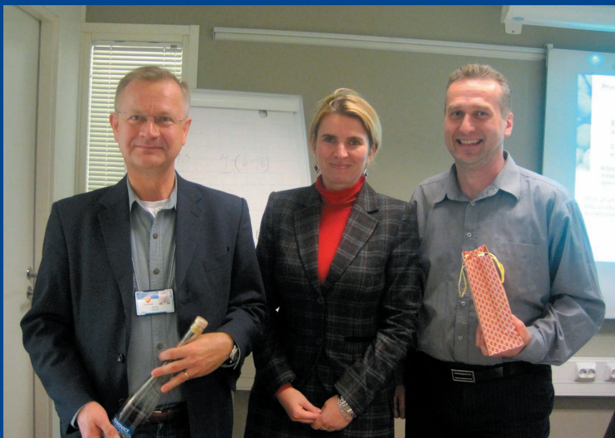
Navázané vztahy jsou více než pracovní.

Počet student se speciálními potřebami v ČR roste. Potřebujeme speciálně vyškolené učitele, koordinátory a asistenty, kteří by tyto studenty podporovali a podávali jim pomocnou ruku. OPISOPPI a KONESOPPI jsou výsledkem projektu financovaného regionem Tampere a Evropským sociálním fondem. Myslím, že připravit a zrealizovat podobný projekt v našem regionu je možné.