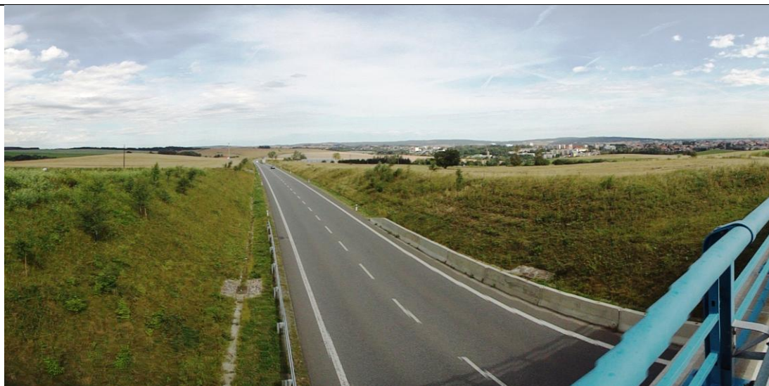
Lokalita č. 1 - celkové panorama z obchvatu města