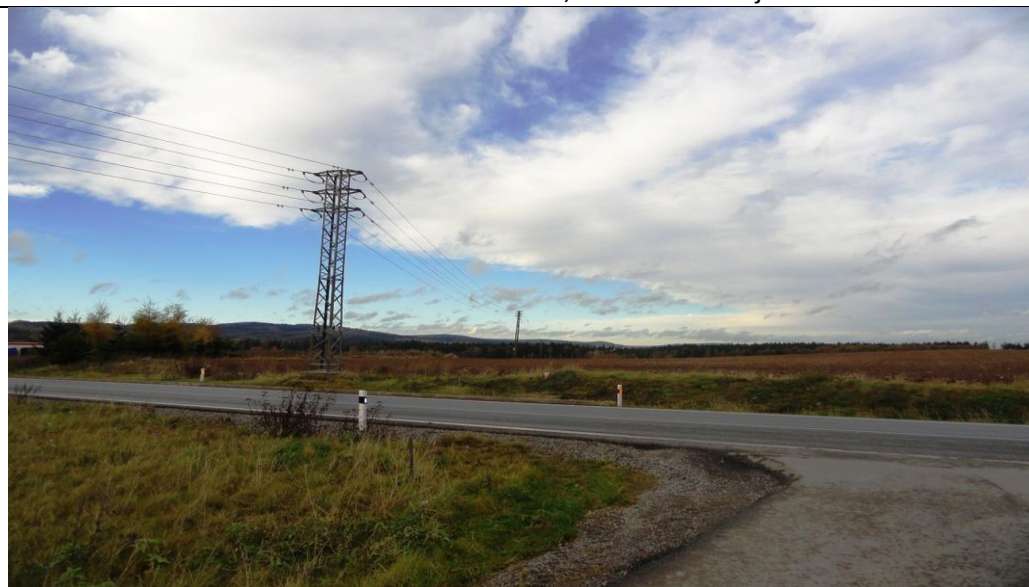
Lokalita č. 4 – pohled z horizontu od Bedřichova k letišti