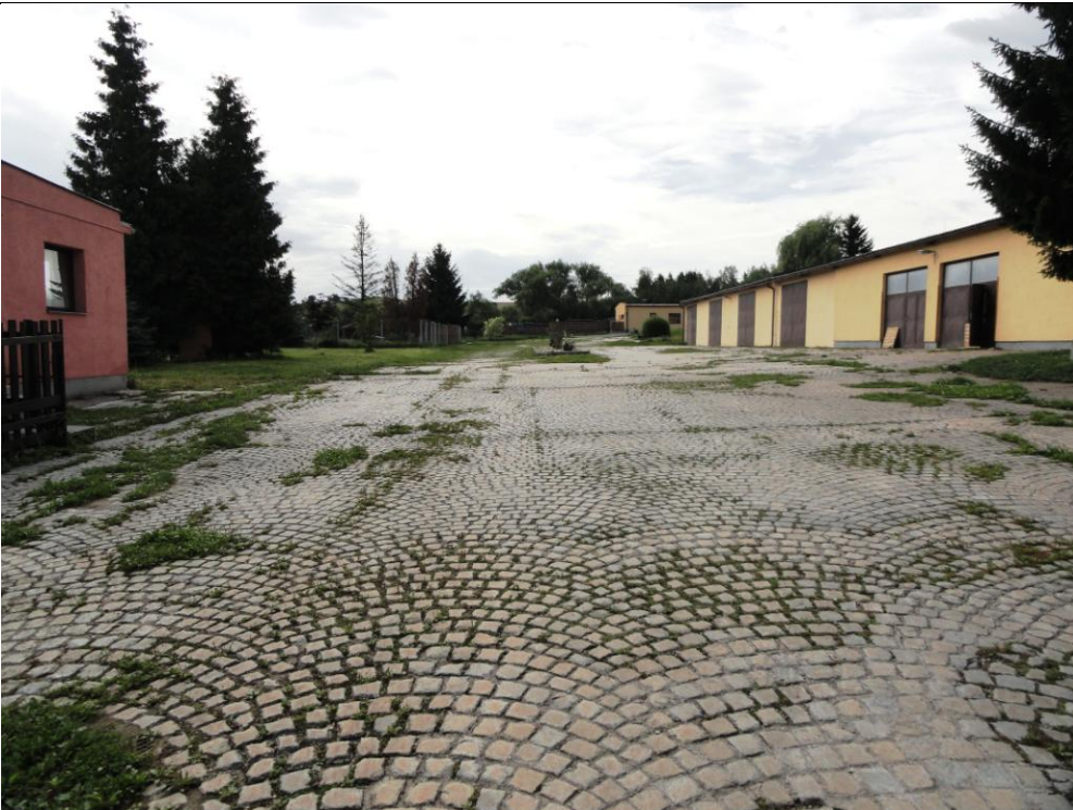
Lokalita č.1 nádvoří