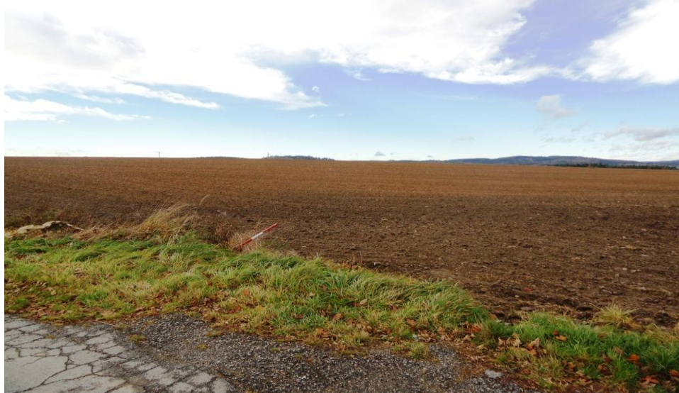
Lokalita č.4 Bedřichov, pohled z předchozího místa na horizont