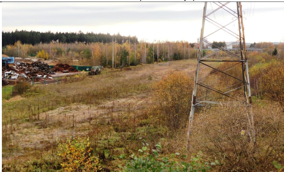
Lokalita č. 3 z železničního nadjezdu Pávov u kovošrotu