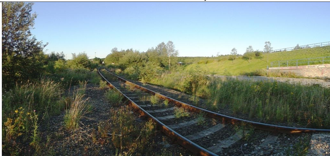
Lokalita č.3 – vlečka do území