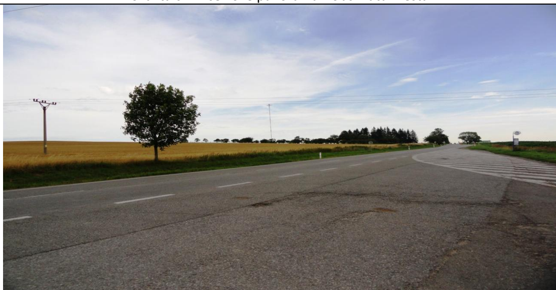
Lokalita č. 2 U Vysílačky, panoramatický pohled z křižovatky u Rančířova