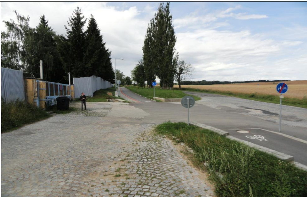
Lokalita č.1 Pístov psinec - vjezd