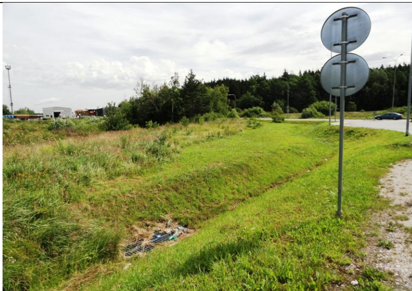
Lokalita č.3 – Pávov od nadjezdu