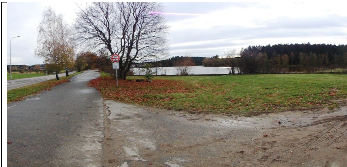
Lokalita č.3 – uvažovaný vodní zdroj rybník Pávov