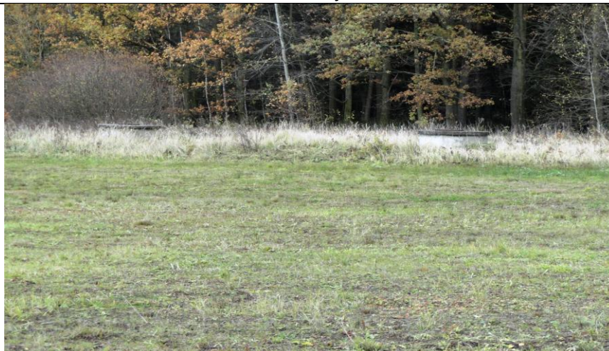
Lokalita č.3 – dvě širokoprofilové studny, které by bylo možno použít pro zásobování vodou v lokalitě 3 i 4