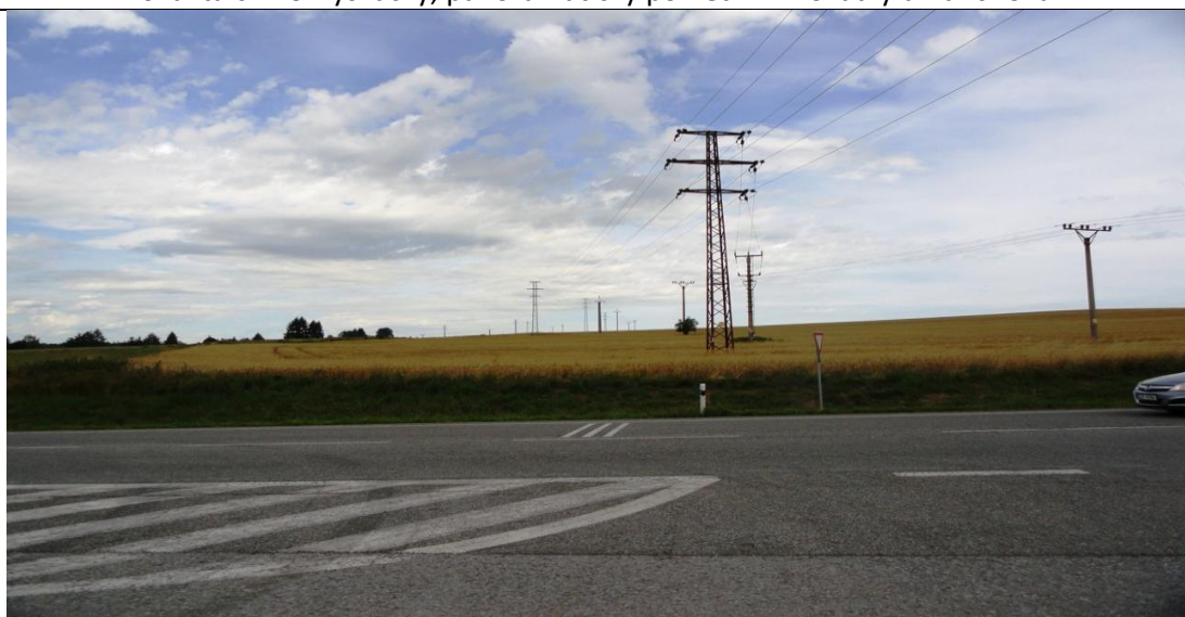
Lokalita č. 2 – poddolované území u vysílačky