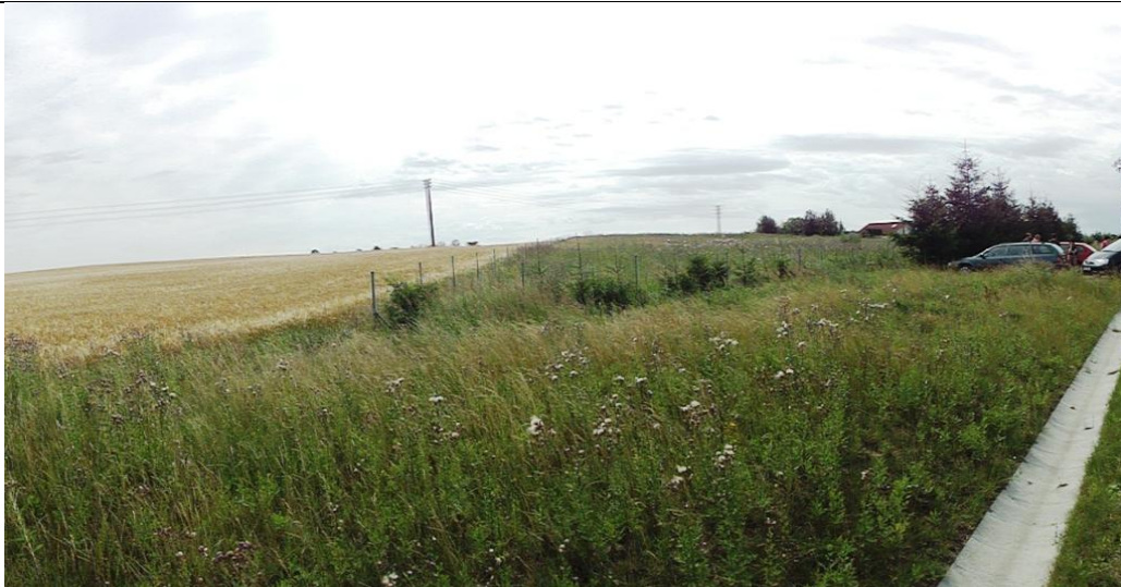
Lokalita č.4 Bedřichov od severu, za horizontem je letiště