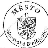
Ing. Vlastimil Bařínka Starosta města Moravské Budějovice