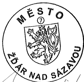
Mgr. Zdeněk Navrátil starosta města Žďáru nad Sázavou