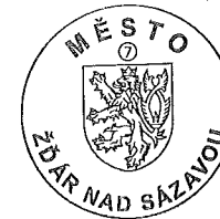
Mgr. Zdeňk Navrátil starosta města Žďáru nad Sázavou