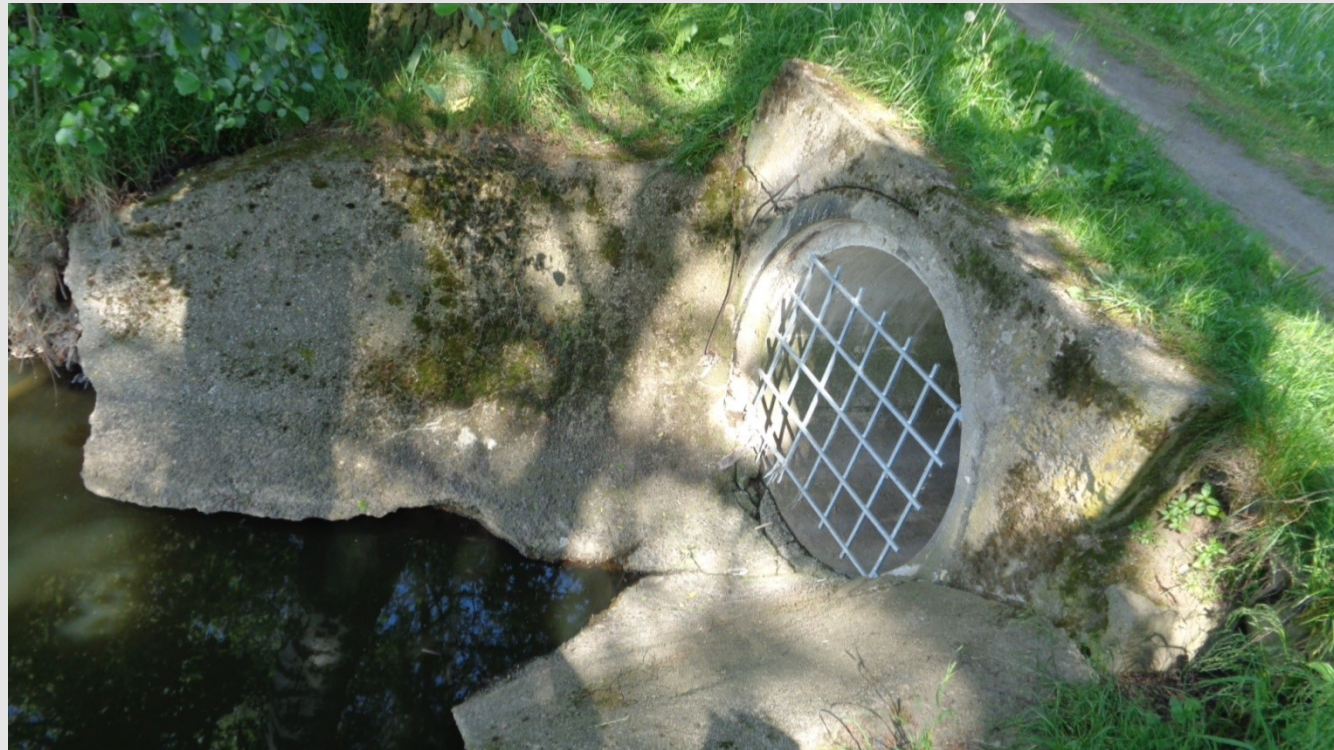
Opravená výust' kanalizace do Třeš'tského potoku v Třešti

V květnu a červnu 2017 provedeno šetření (kontrola) na výustích kanalizací s rizikovostí 2 - 4. U většiny výustí byla přijata opatření a nebylo žádné znečištění zjištěno. V dalších případech jsou opatření připravována či realizována .