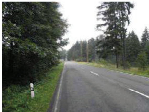
Pohled na komunikaci I/19 směrem na Rovné