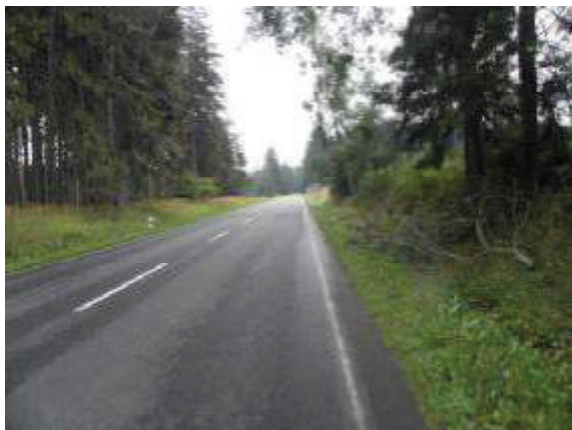
Pohled na komunikaci I/19 směrem na Bystřici nad Pernštejnem