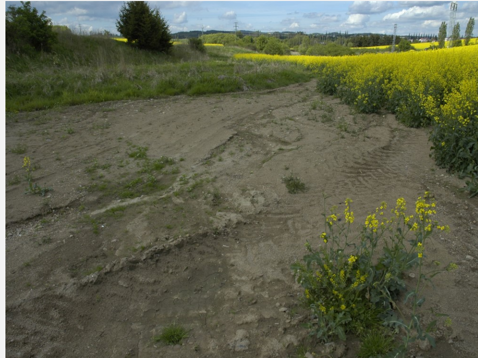
Eroze před realizací stavby