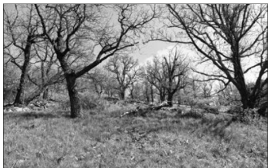
Knížecí seč, autor Ester Ekrťová

Zvláště chráněné území nazvané Výrova skála najdeme v údolí