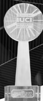
Nejlepší světový pohár Cross-Country Olympic 2018. Nové Město na Moravě.