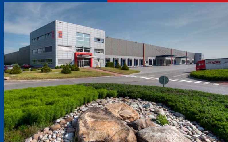
JIPOCAR Logistic, s.r.o. Logistické centrum LCJ Invest a.s.