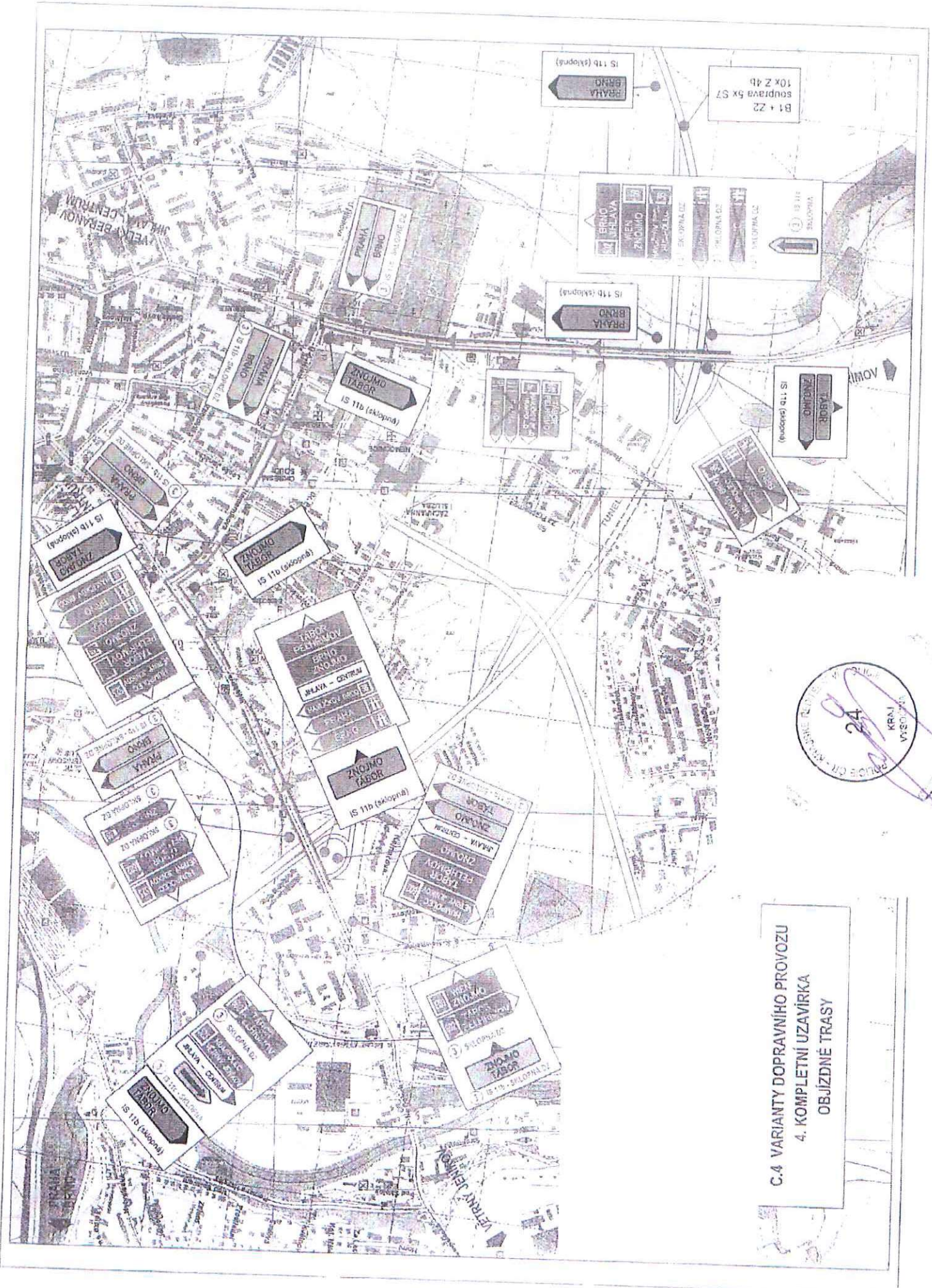
C.4 VARIANTY DOPRAVNÍHO PROVOZU 4. KOMPLETNÍ UZAVÍRKA OBJÍZDNÉ TRASY