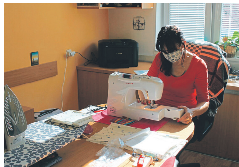
Lidé na Vysočině se pustili do šití roušek ve velkém, šili nejen dobrovolníci, ale i úřady, firmy, lidé bez práce i samotní senioři

vačům a lékařům, studenti zpívali pod okny Domovů pro seniory a LDN.