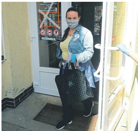
Dobrovolníci zajišťovali nákupy pro seniory

Po vyhlášení nouzového stavu se pracovníci Oblastní charity dohodli s Magistrátem města Jihlavy na spolupráci při vytvoření krizového dobrovolnického centra se sídlem v prostorách Turistického informačního centra na Masarykově náměstí v Jihlavě. Důvodem bylo zajištění co nejúčinnějšího centrálního systému pomoci potřebným obyvatelům města. Do systému se hlásili lidé, kteří potřebovali pomoc a registrovali se dobrovolníci, kteří nabízeli různé formy pomoci.