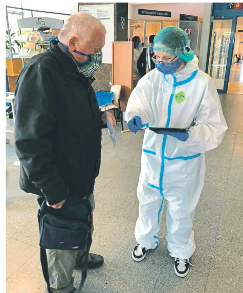
V nemocnici Jihlava se během krizové situace způsobené koronavirem zapojilo do různých činností velké množství nových dobrovolníků. Vzhledem ke specifickému prostředí nemocnice využili především zdravotníky a studenty zdravotnických oborů, kteří již mají zkušenost s ochrannými pomůckami a jejich používáním

S doučováním mají dobrovolníci z Portima zkušenosti, ať již z provozu sociálních služeb (Sociálně aktivizační služby pro rodiny s dětmi, Nízkoprahové zařízení pro děti a mládež), anebo přímo v rámci dobrovolnického programu Kámoš. V době epidemie mohlo být pro rodiče domácí vzdělávání velice náročné, a proto se dobrovolníci v Portimu rozhodli rodičům tuto roli usnadnit. Organizace má ve svých řadách několik dobrovolníků – učitelů. Ti jsou k dispozici např. na Messengeru nebo Skypu, případně i na telefonu. Žáci s nimi mohli konzultovat úkol, se kterým si nevěděli rady, nechat si dovysvětlit nové učivo, které nechápou, anebo se např. připravovat na přijímací zkoušky na střední školu.