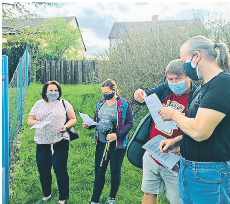
„Zpívání přes plot“ je aktivita třebské Charity pro klienty Domova pro seniory