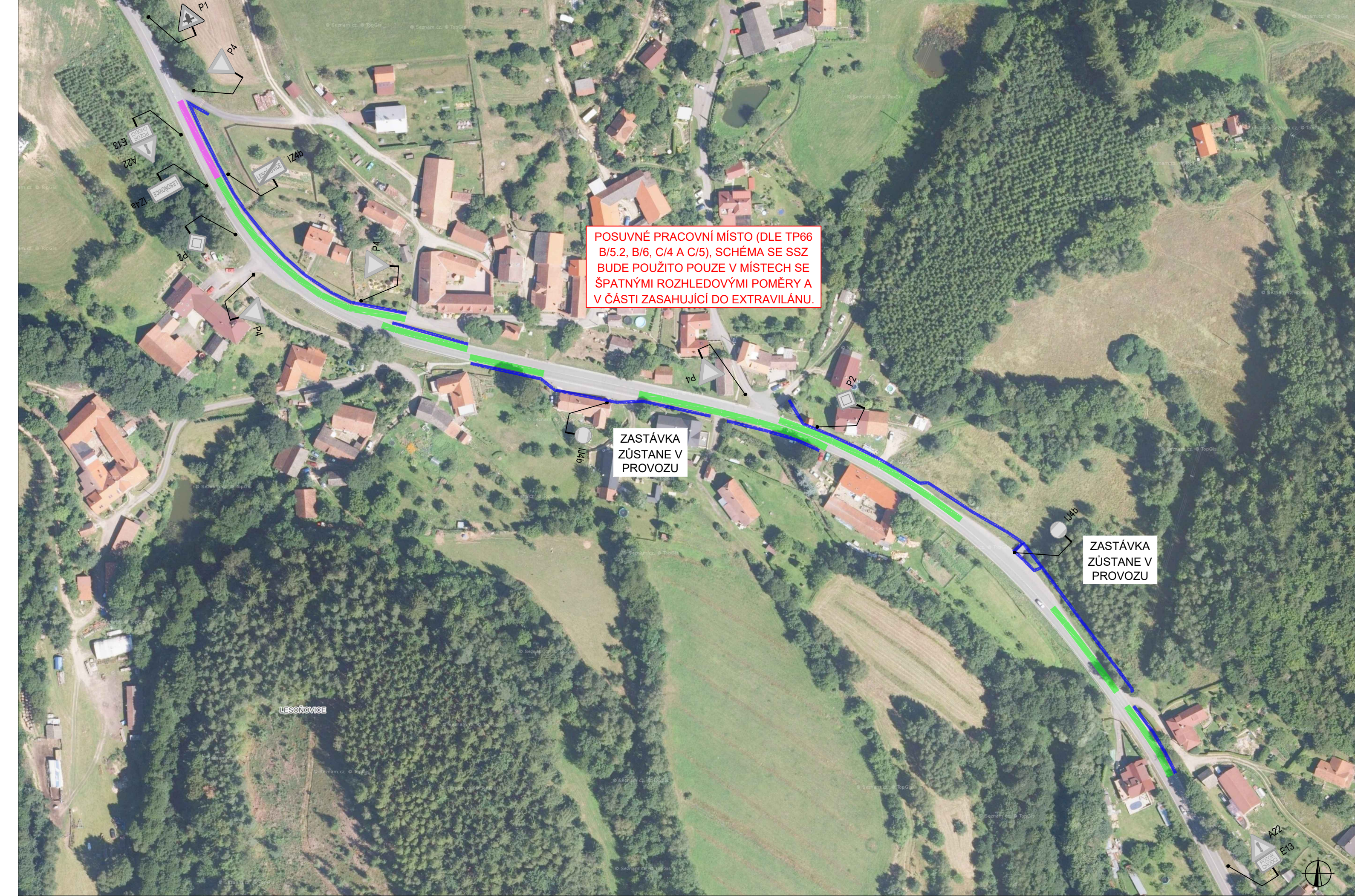
SCHÉMA POSUVNÉHO PRACOVNÍHO MÍSTA