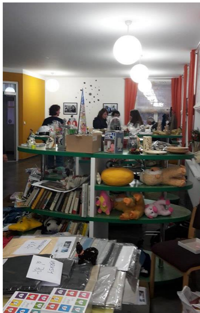
Vánoční dobročinný bazar