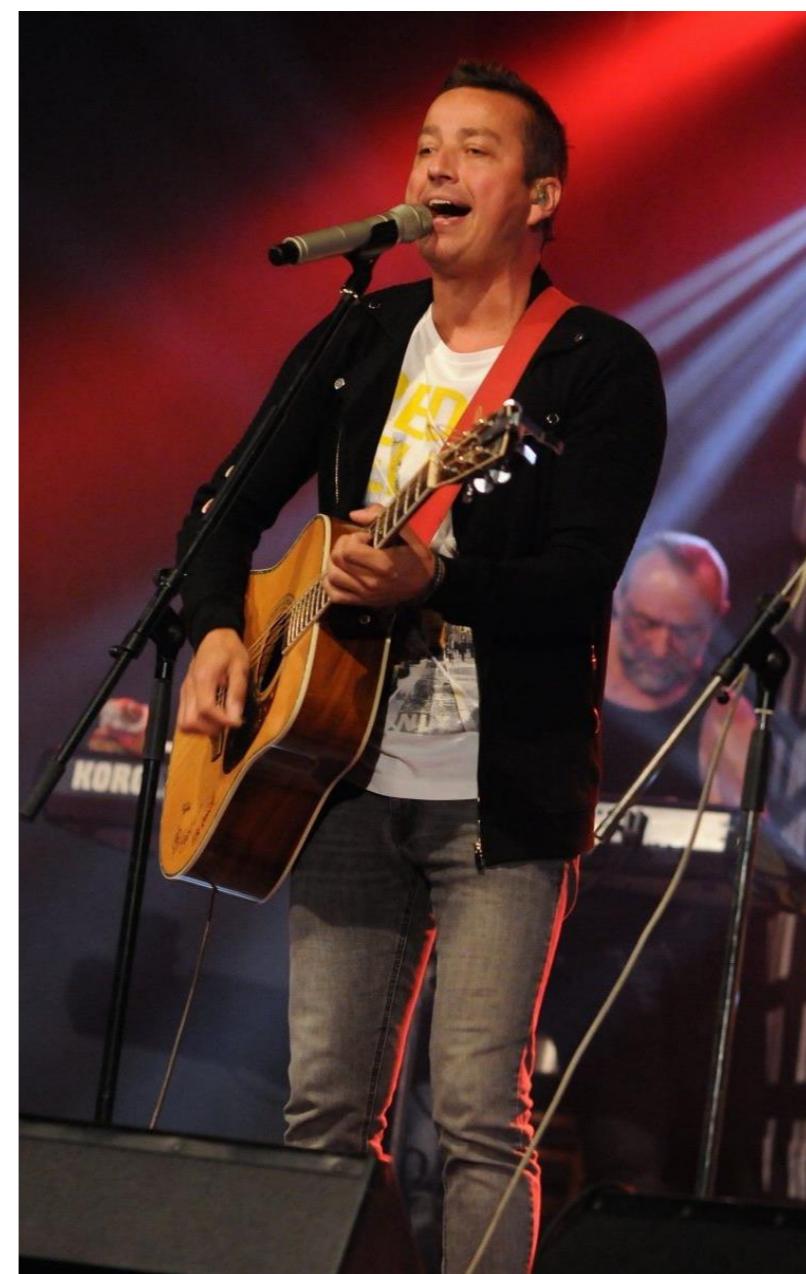
Hudba pro Pohodičku