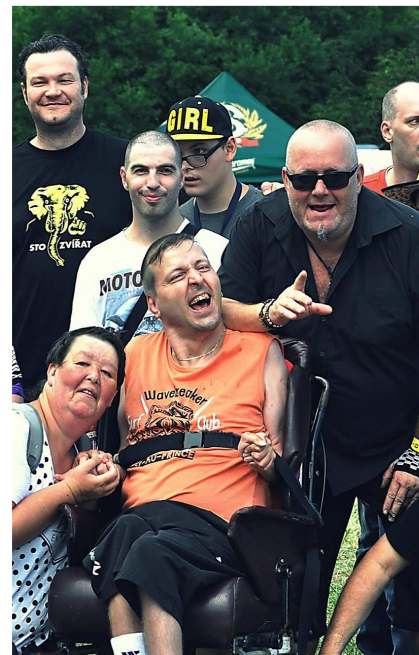
Lidi s hendikepem tvoří součást společnosti