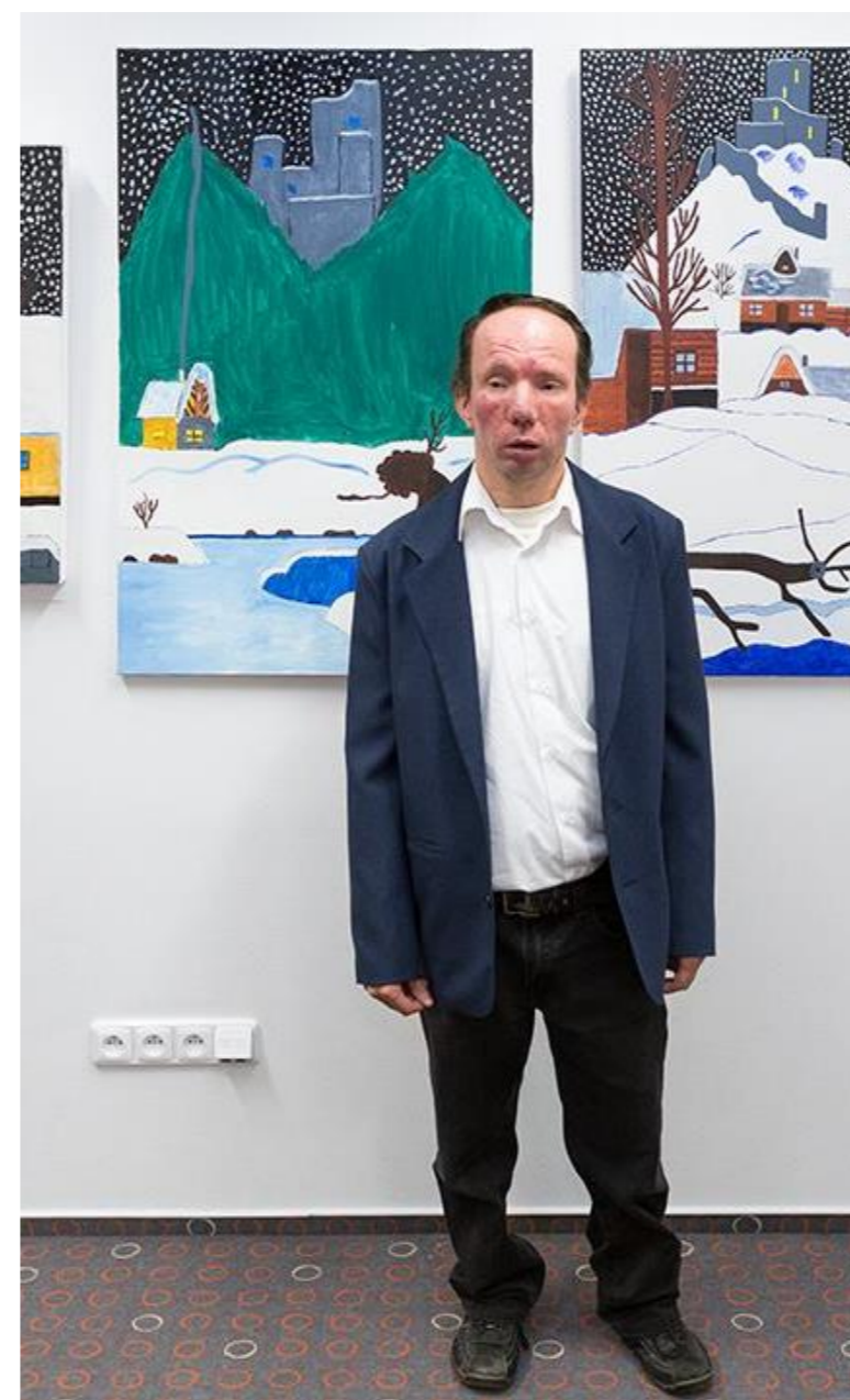
Výstavy, přednášky a promítání v naší kavárně