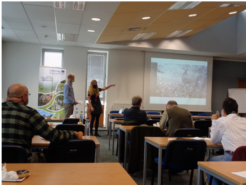
Ein Projekt aus dem Programm INTERREG V-A Österreich-Tschechische Republik für die Programmperiode 2014-2020