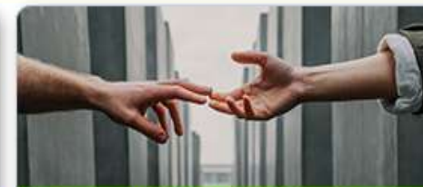
Sociální oblast a zdravotnictví