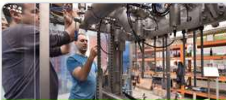
Podnikání a inovace