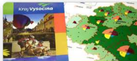
Regionální rozvoj a veřejná správa