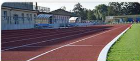
Volnočasové aktivity a sport