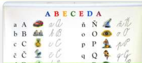
Vzdělávání a školství