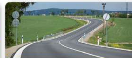
Doprava a mobilita