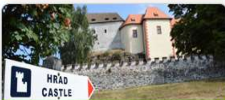
Kultura a památková péče