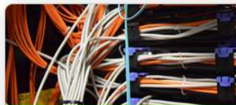
Informační a komunikační technologie