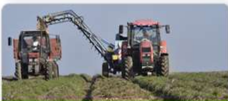
Životní prostředí a zemědělství