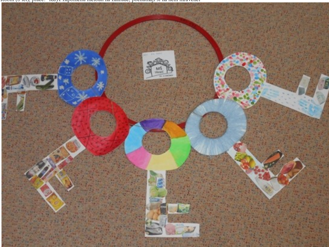
MŠ U Obůrky, práce "5 klíčů"