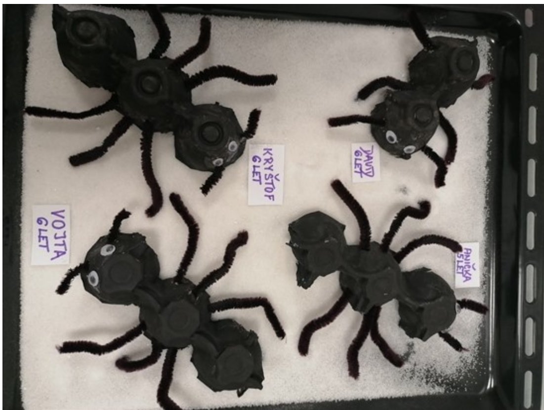
MŠ Klásek, práce: "Mravenci v kredenci"