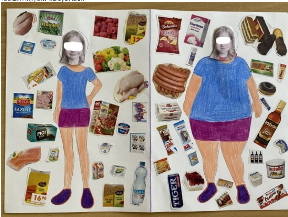
Anežka (5 let), práce: "Zdravá a nezdravá strava"