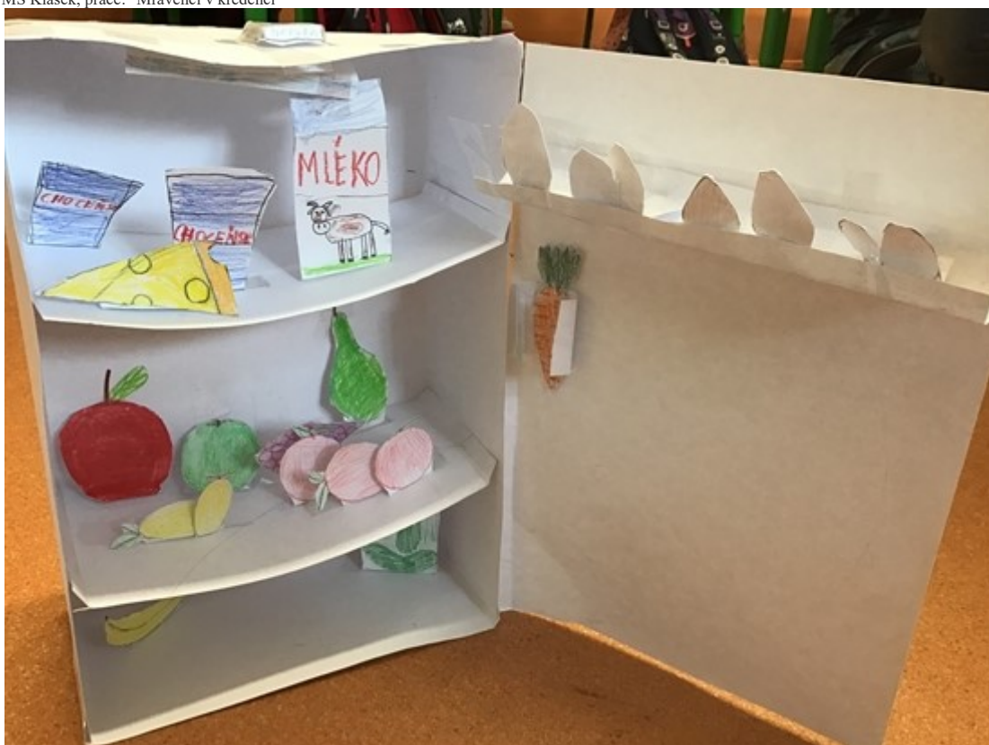
Matěj (9 let), práce: "Lednice zdraví"