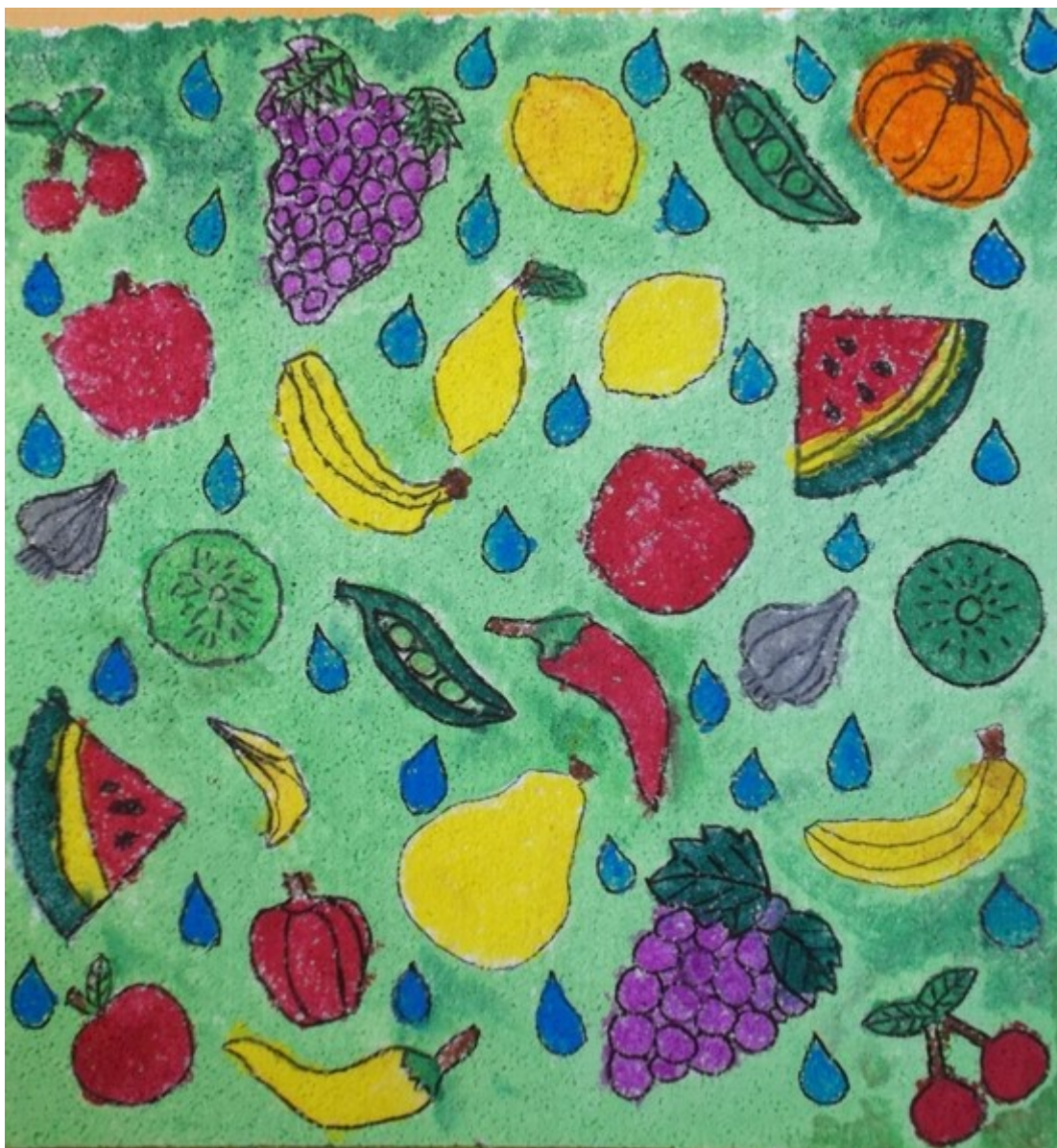
MŠ Herálec, práce: "Omyté dobroty"