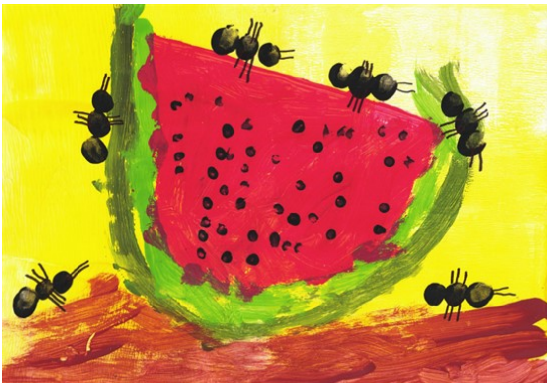
Robin (6 let), práce: "Když zapomenu meloun na zahradě, pochutnají si na něm mravenci"