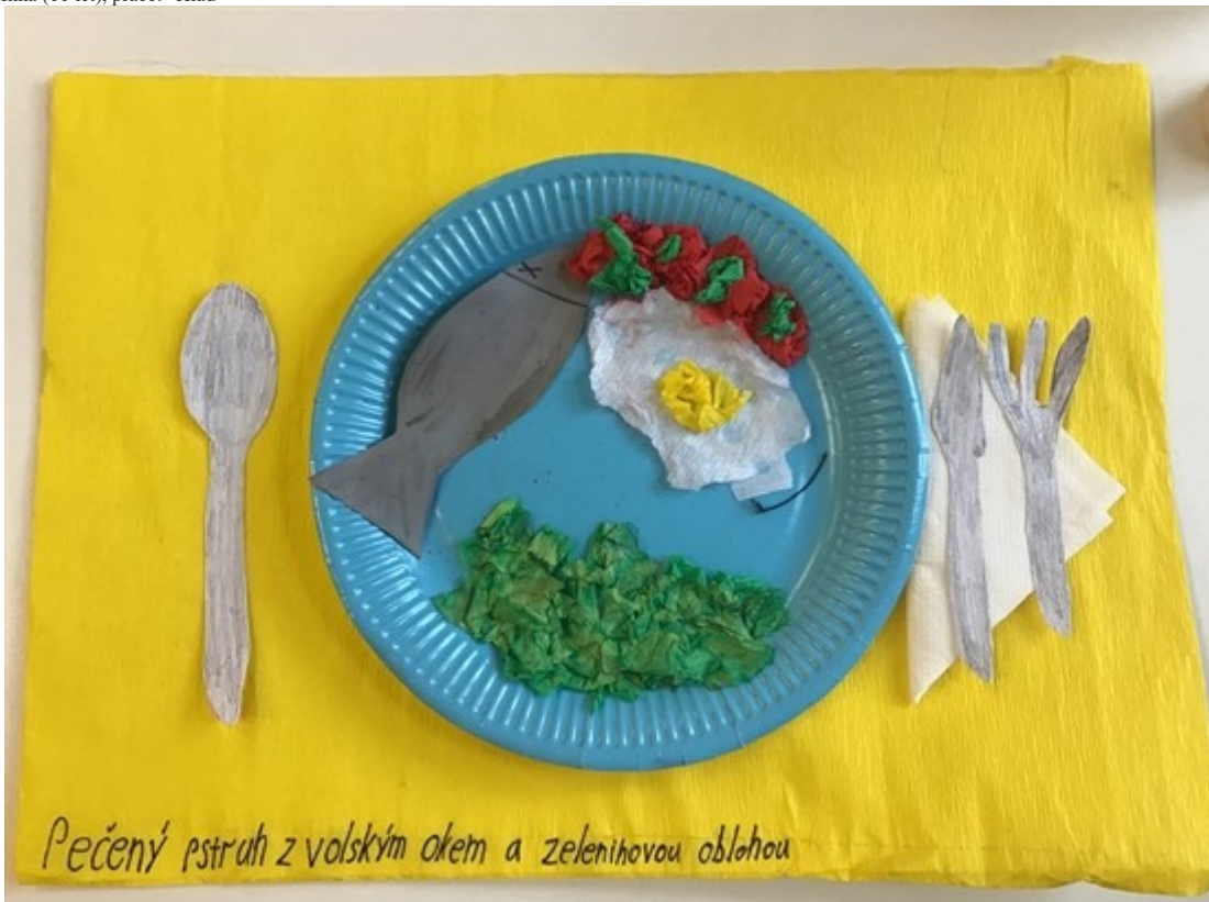
Liana (10 let), práce: "Pečený pstruh s volským okem a zeleninovou oblohou"