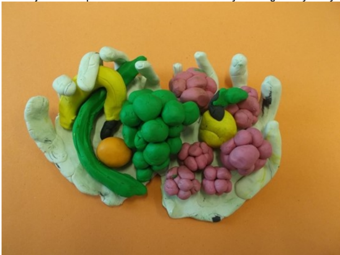
Veronika (6 let), práce: "Dlaně plné zdraví"

Pro vzájemnou inspiraci sdílíme některé ze zaslaných fotografií výtvarných prací.