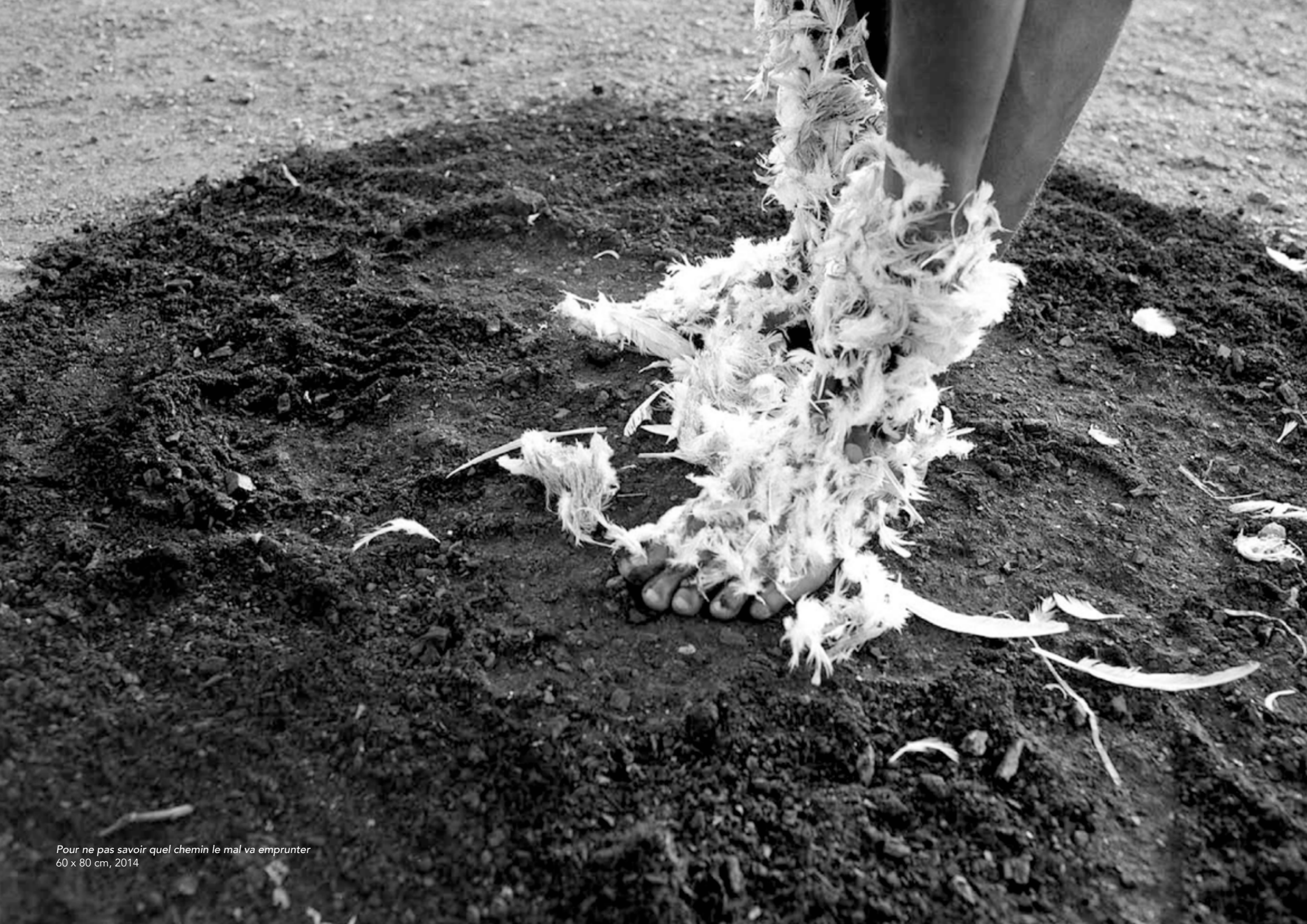
Pour ne pas savoir quel chemin le mal va emprunter 60 x 80 cm, 2014