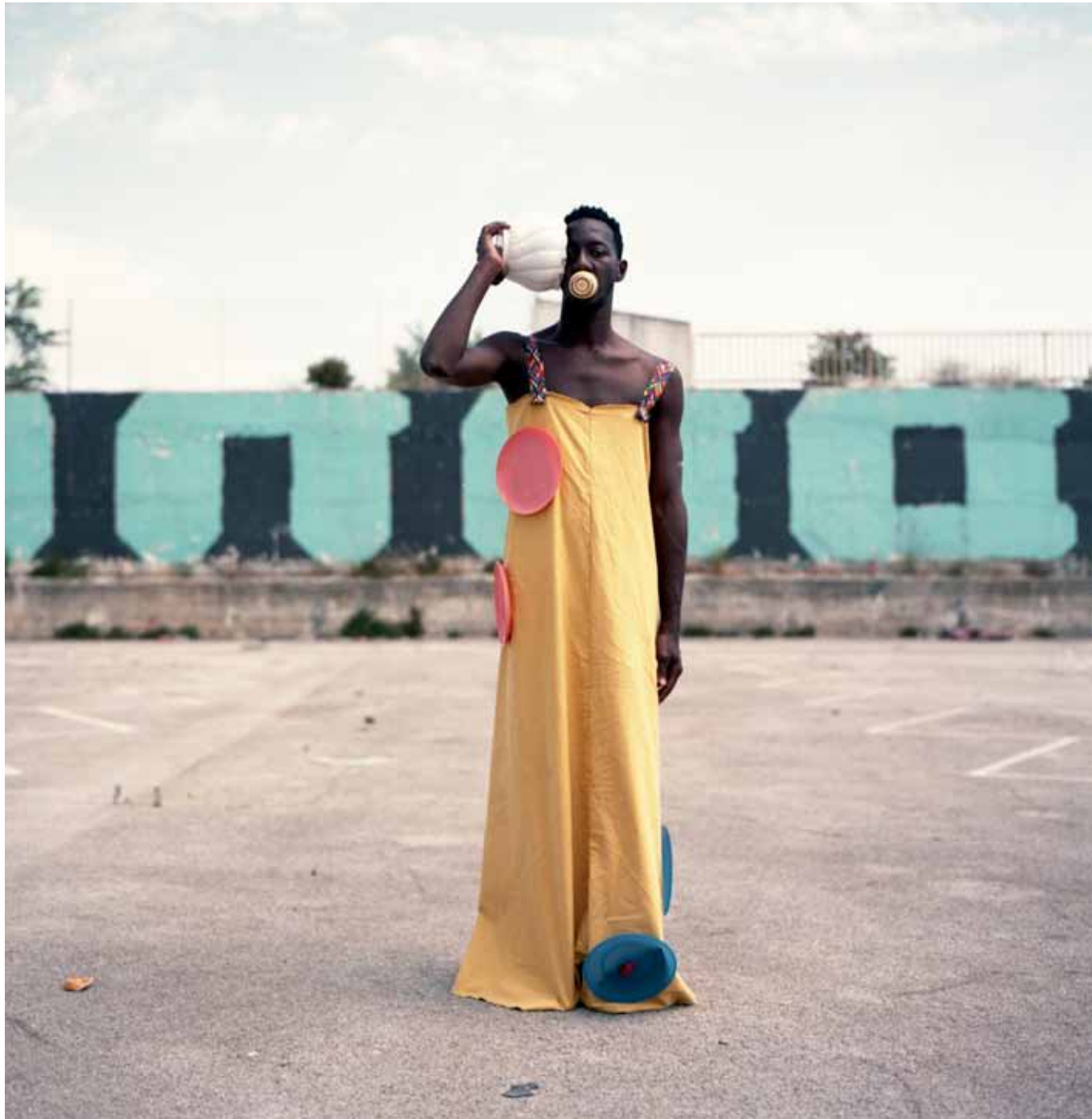
Kaolin, Marché aux puces, Marseille Dimension variable - 2019