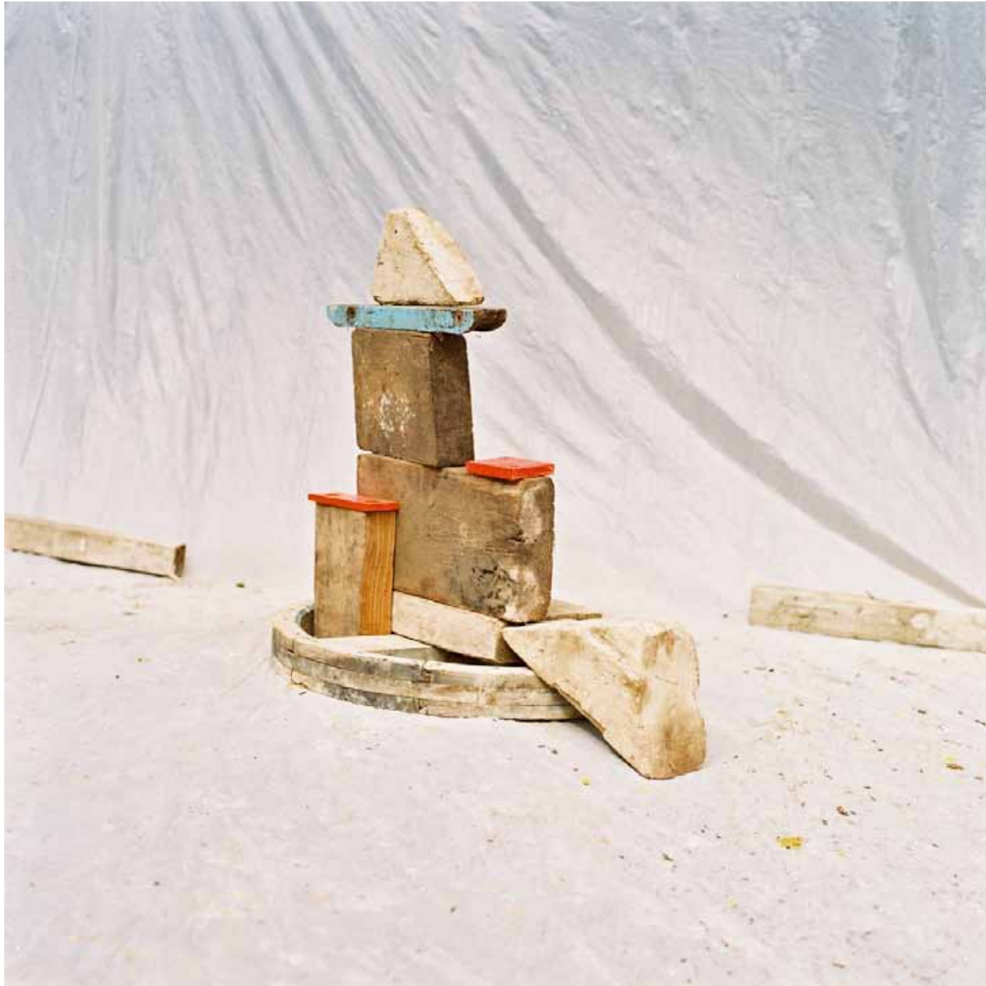
Extrait de La chaux moisson Dimension variable - 2020