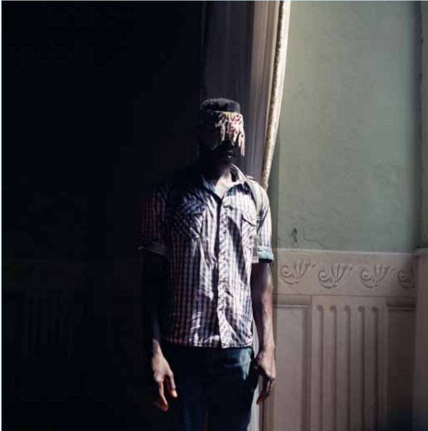
Sans titre, 50 x 50 cm, 2018

Sont-ils vivants ou morts ces corps, debout, dans une arène que leurs yeux ne voient pas? Qu'importe ! La mort et la vie se confondent, si joliment, dans les vertigineux récits, sur les aventuriers, qui se racontent au village. Qu'importe leurs visages, leurs noms, leurs destins ! Ils sont des soldats morts au combat. Ils sont des rois quel que soit, là où ils sont !