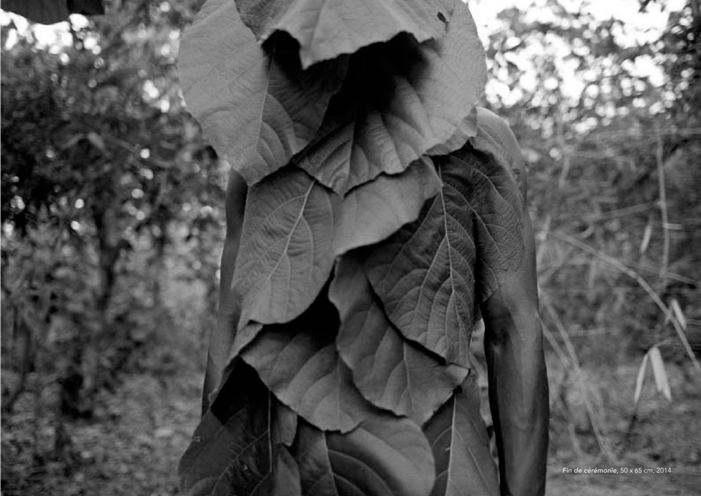
Fin de cérémonie, 50 x 65 cm, 2014