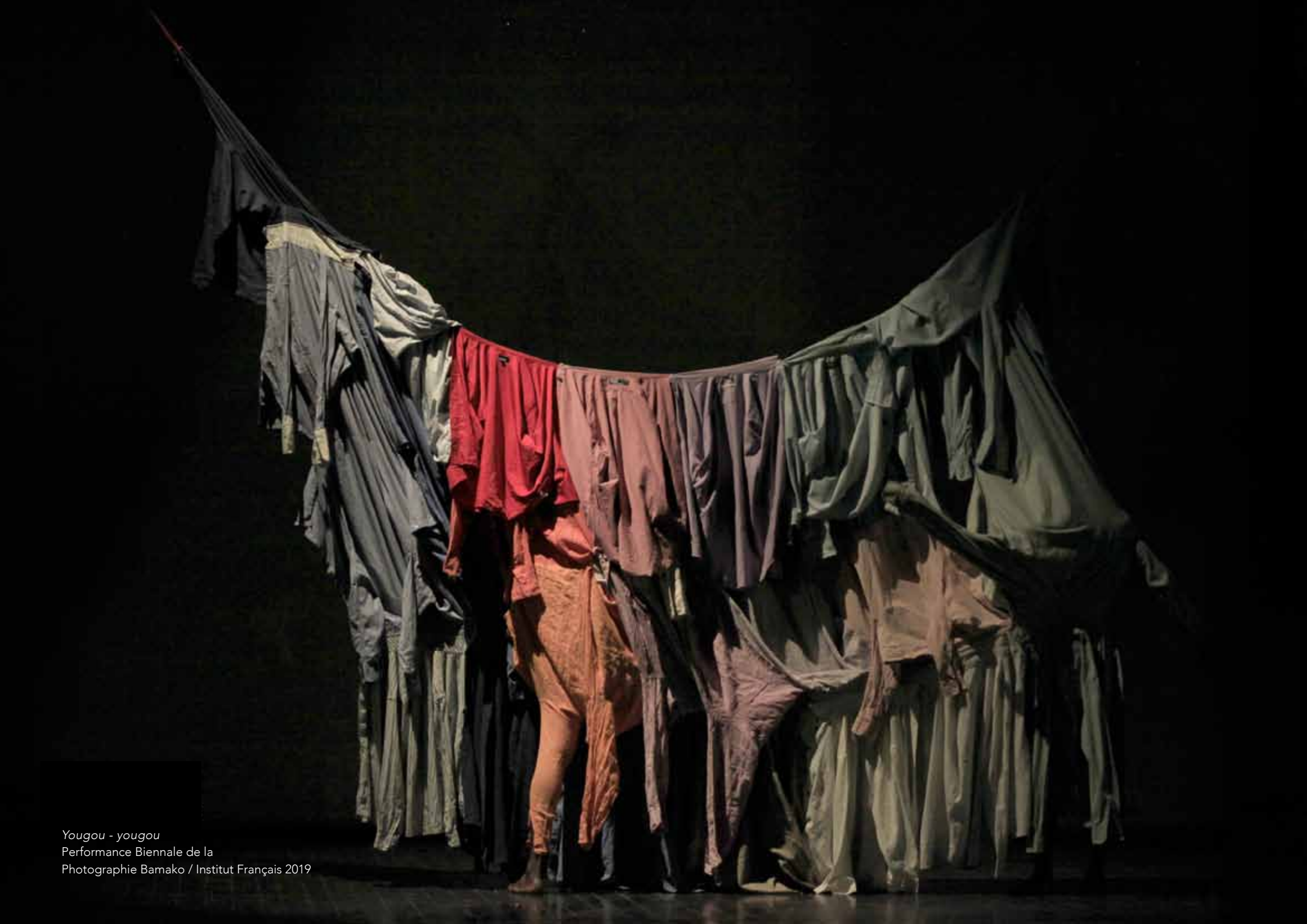
Yougou - yougou Performance Biennale de la Photographie Bamako / Institut Français 2019