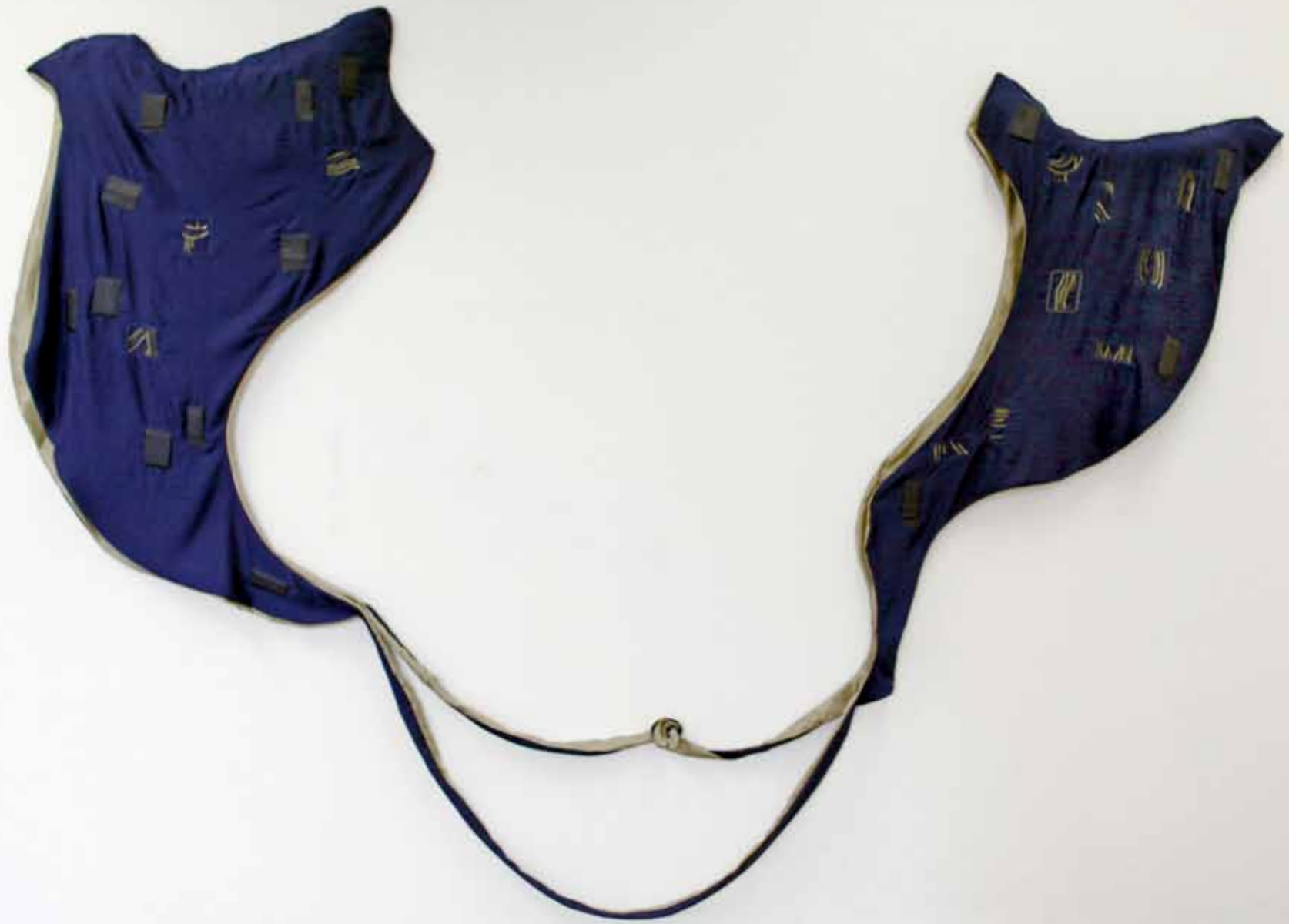
L'affront textiles brodés 2m20 x 3m35 2016