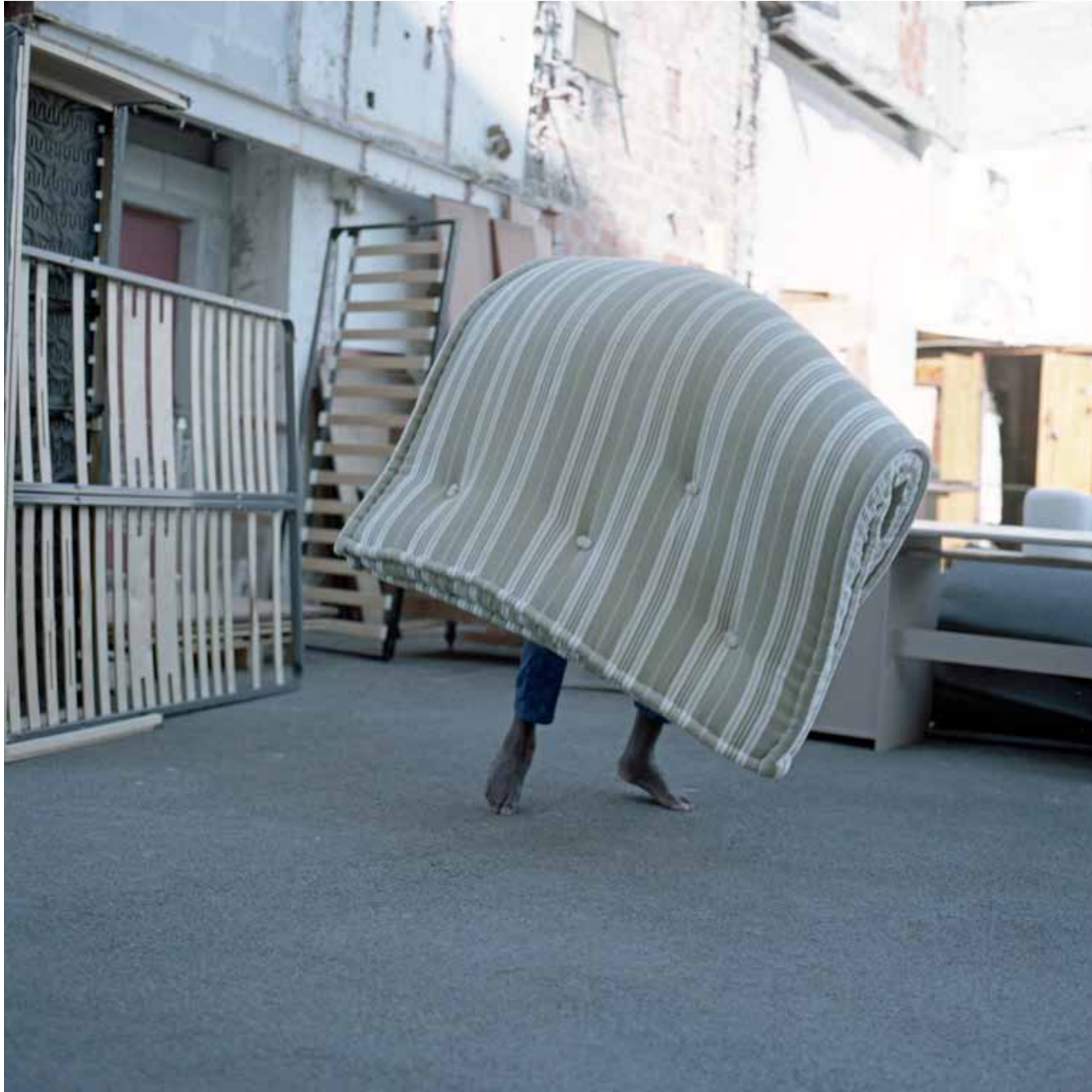
Sans titre - Emmaus St Marcel, Marseille 1 x 1m - 2019