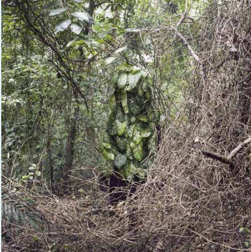
Sans titre, 1 x 1m, 2014