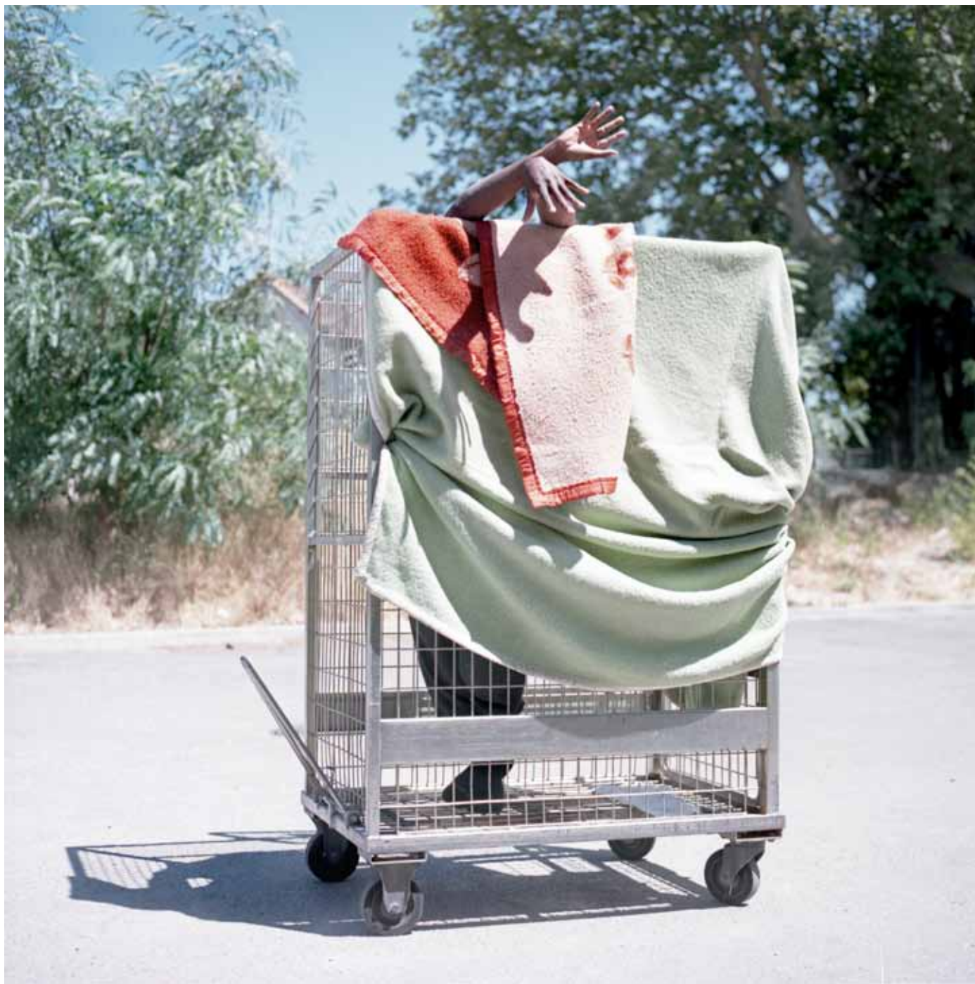
Sans titre, Emmaus St Marcel, Marseille 1 x 1m - 2019