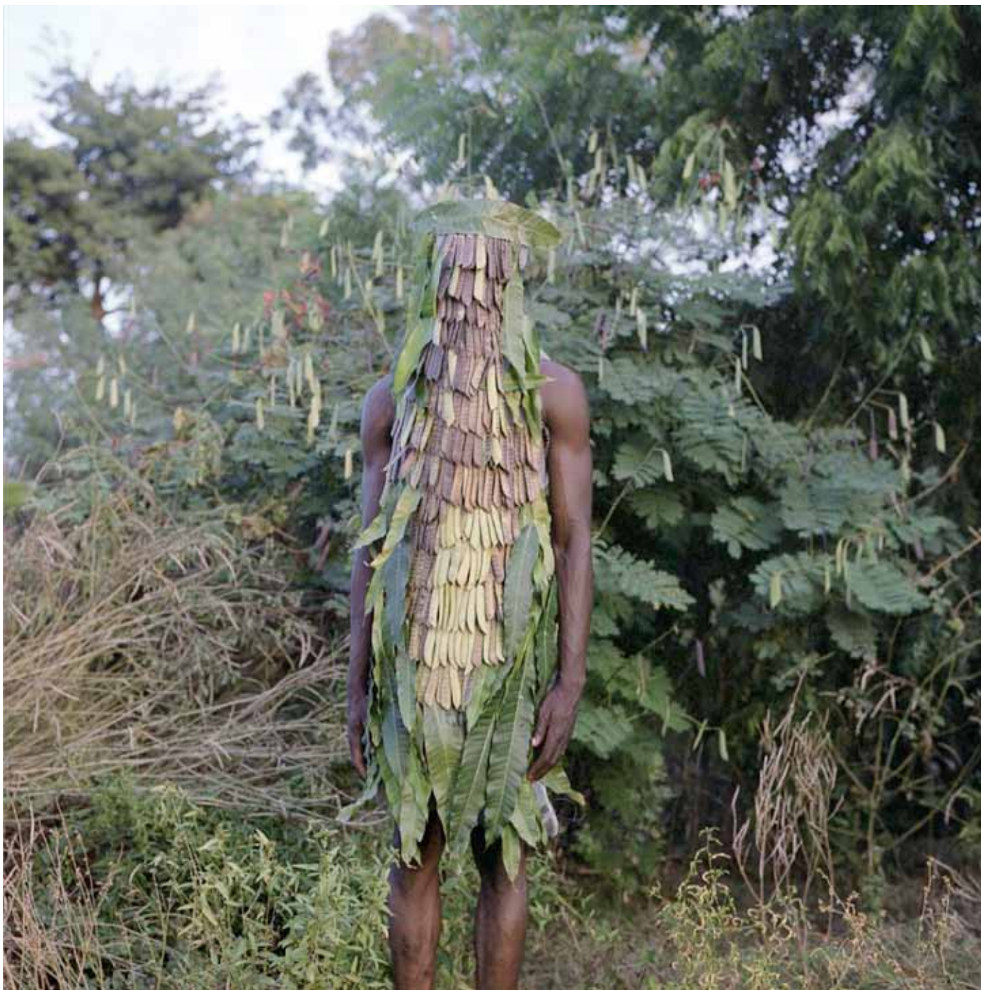
Sans titre, 1 x 1m, 2014