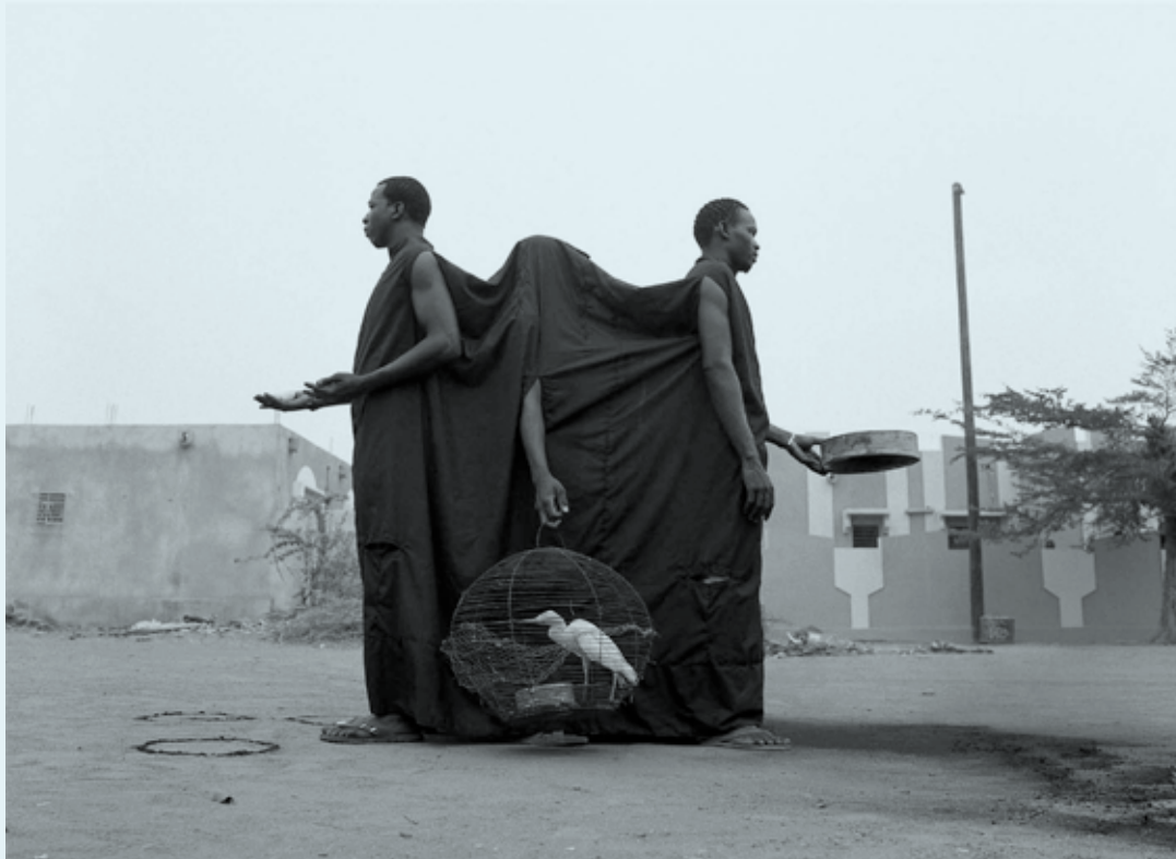
Le juge, 50 x 65 cm, 2013