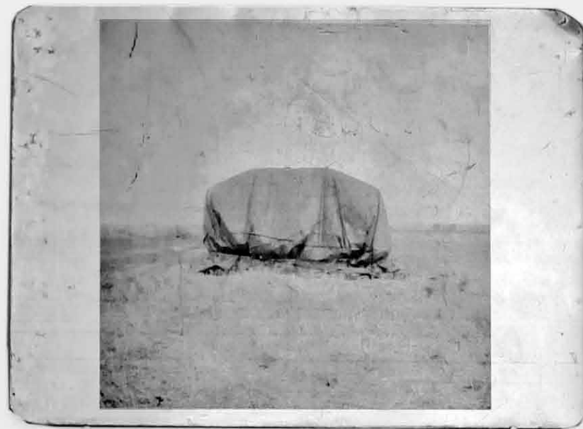
Extrait de La chauve moisson Impression sur plaque métallique de signalétique agricole 30 x 40 cm - 2019