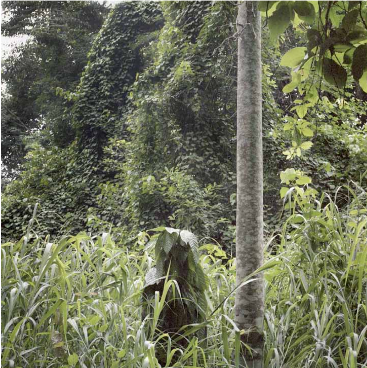
Sans titre, 1 x 1m, 2014