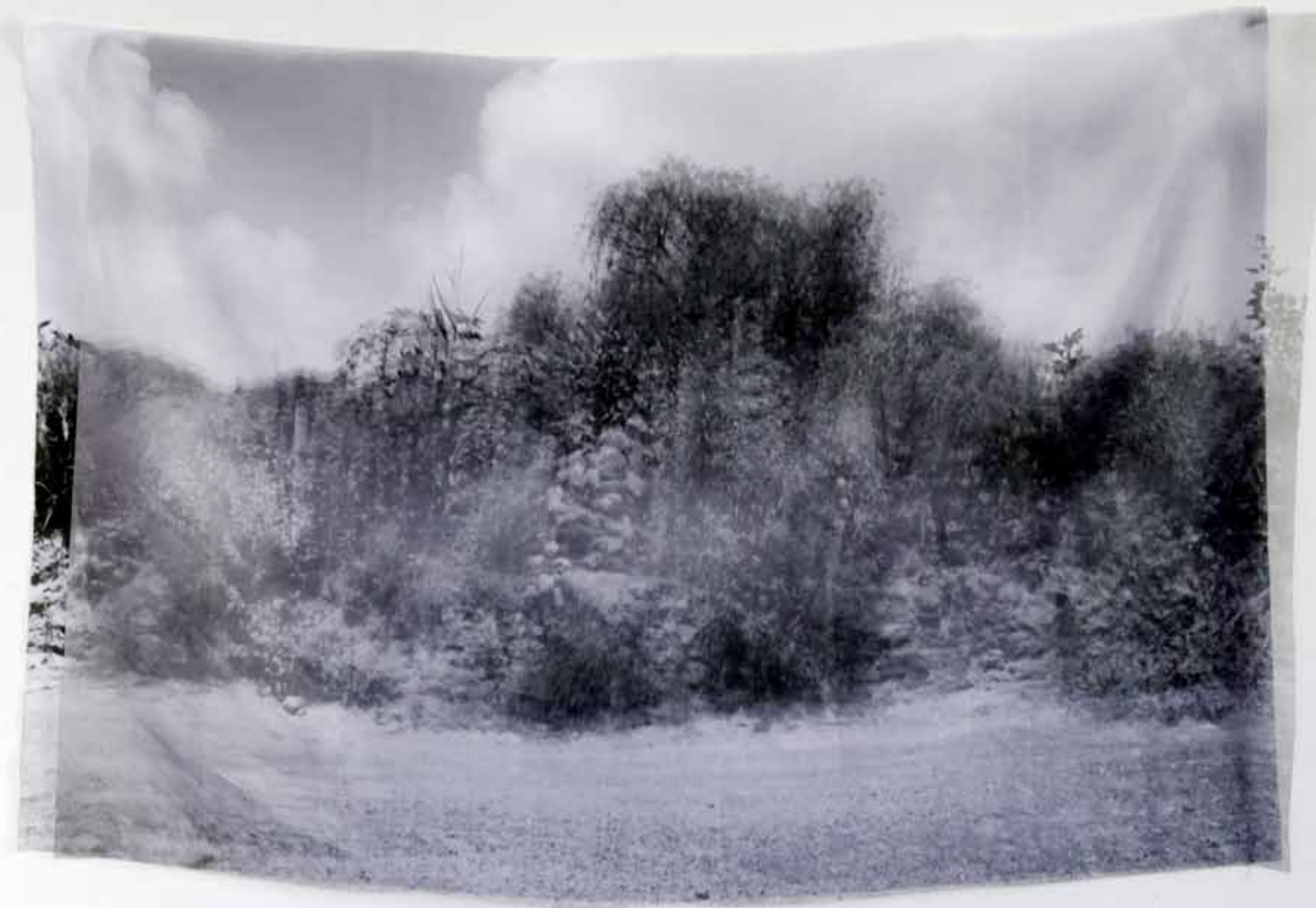
Whip up the soils Double impression textile 70 x 100 cm - 2019