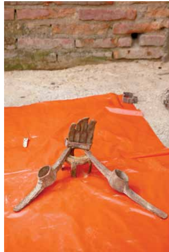
Silex 80 x 53 cm Tirage contrecollé - 2019