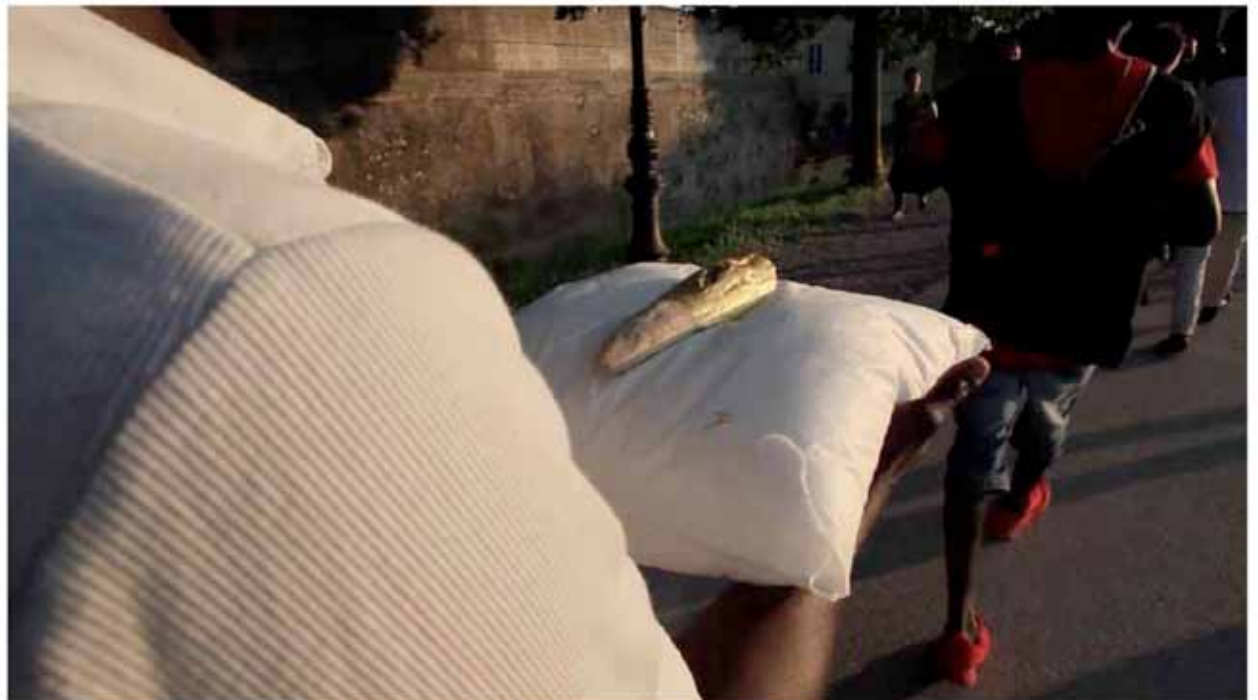
The arena in the arena Captures d'écran vidéo de la performance Lucca - Italie 2018