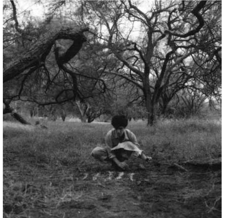
Semer n°2 Extrait de Tres surcos Dimension variable- 2019