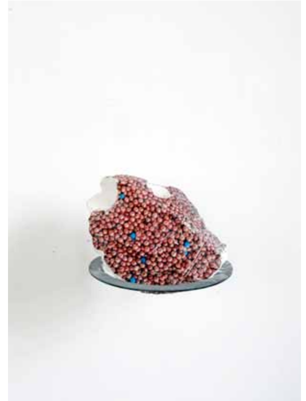
Lisier, La balise nitrate et les Graines Dimensions variables Transfert photographique sur craie, 2020