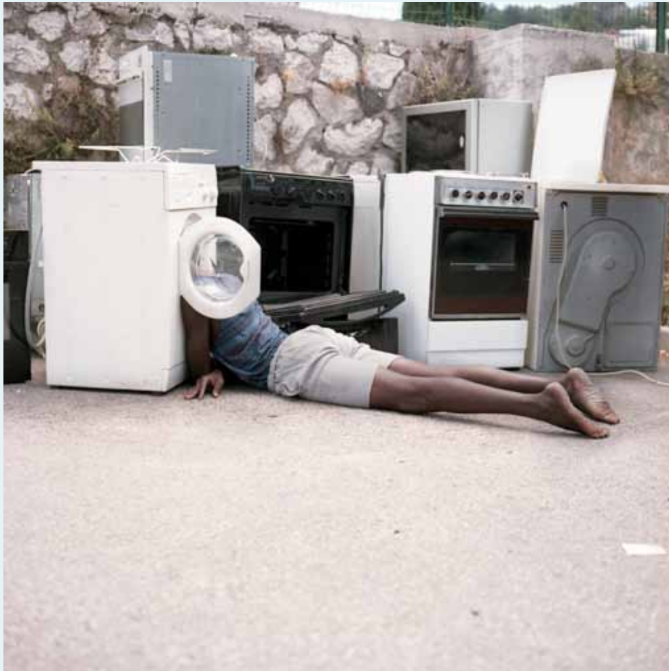
Sans titre, Emmaus St Marcel, Marseille - Dimension variable - 2019