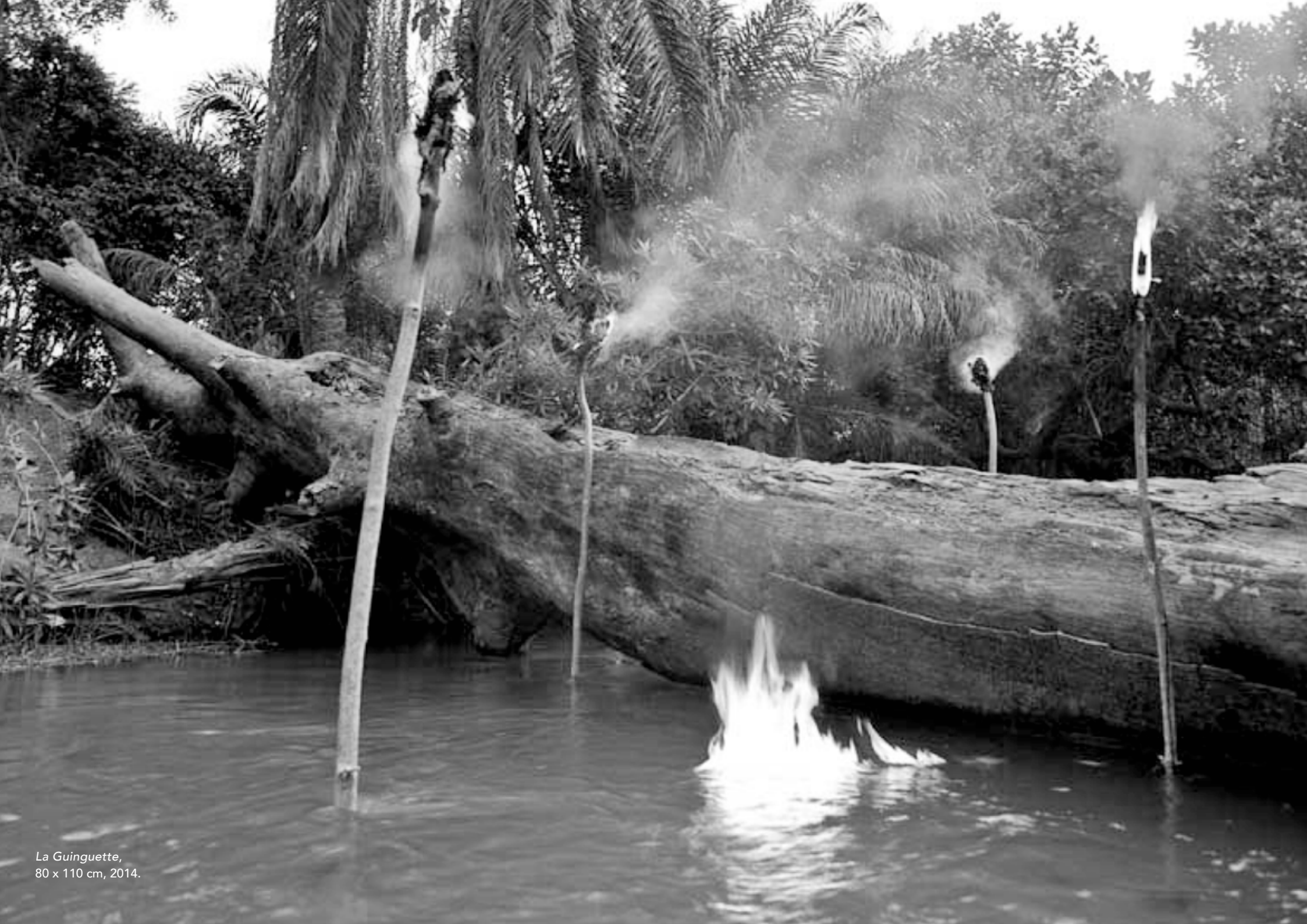
La Guinguette, 80 x 110 cm, 2014.