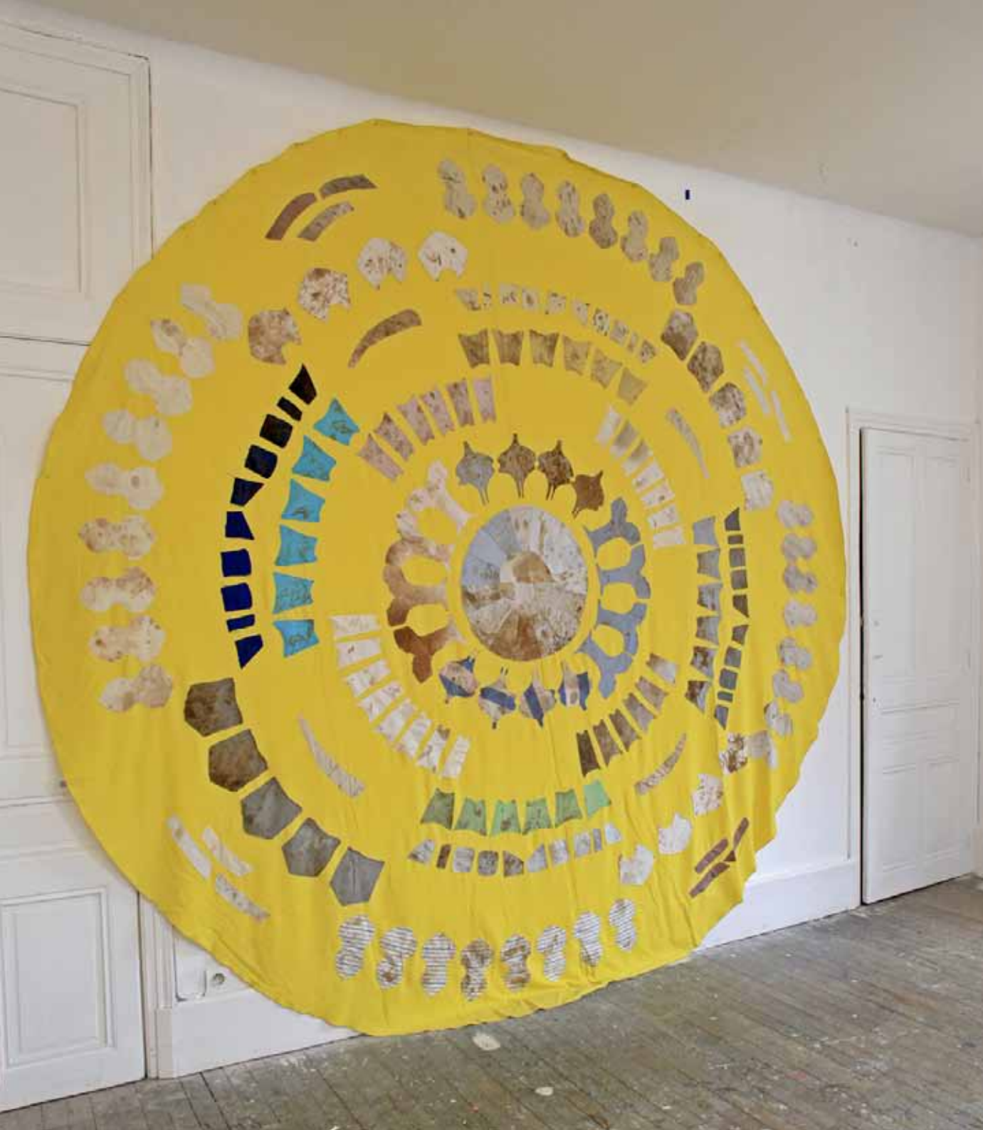
Piel(s) Textile 3m de diamètre - 2016