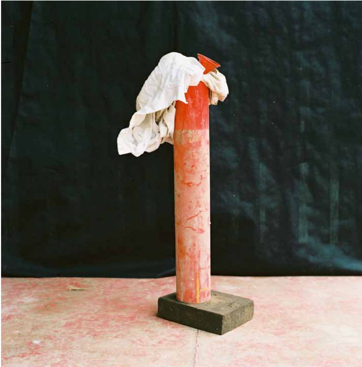
Extrait de La chauve moisson Dimension variable - 2020