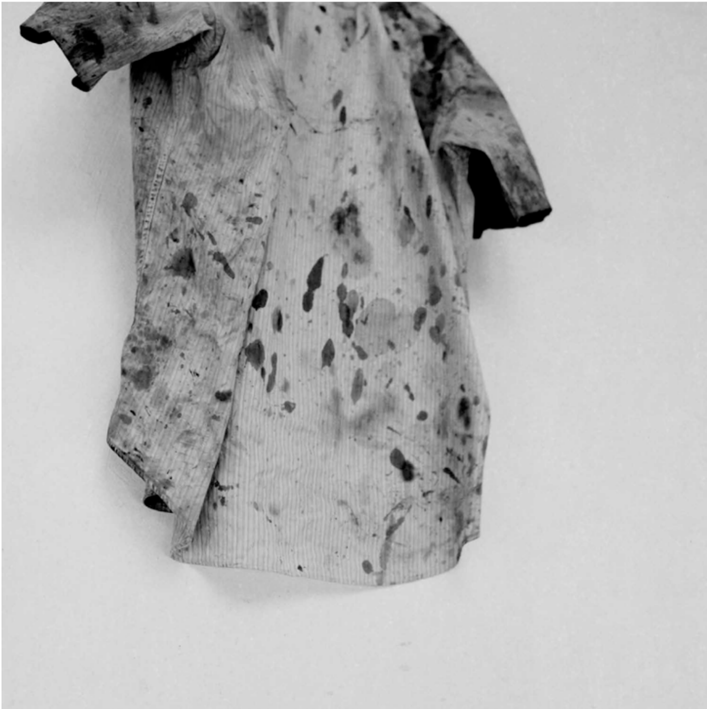
Camisa Extrait de Tres Surcos 70 x 70 cm - 2016