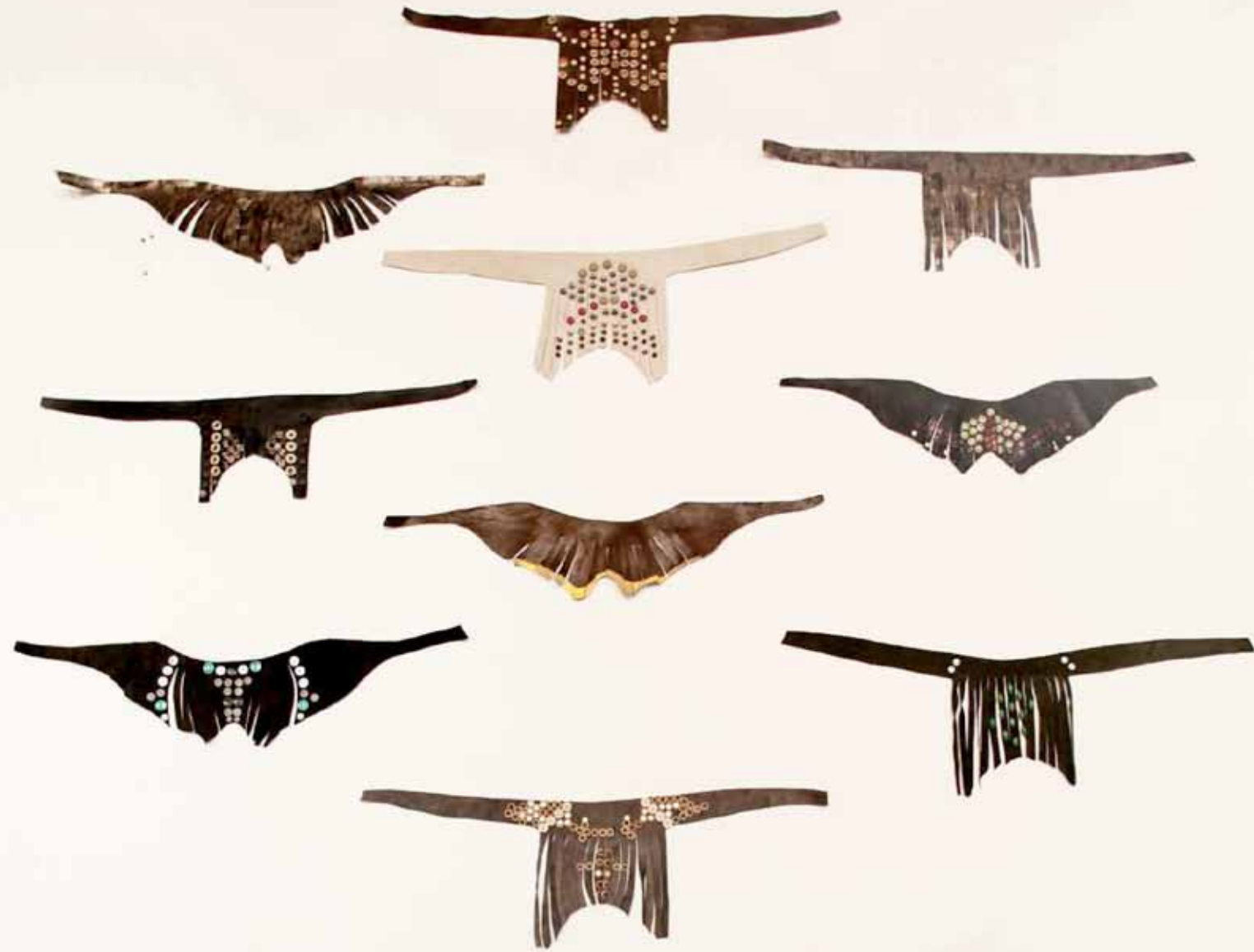
The arena in the arena 12 masques cuir et boutons 2018