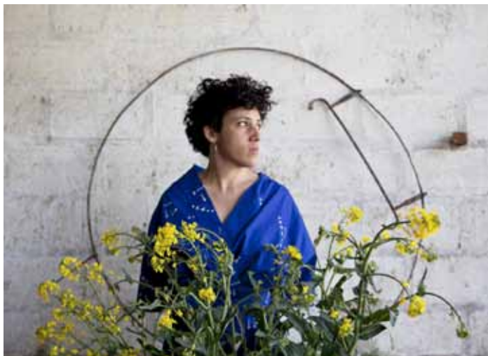
Bleu charette / Autoportrait - 2020