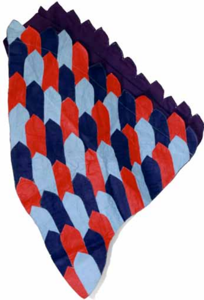
Prosperité Bazin - 75 x 105 cm 2015