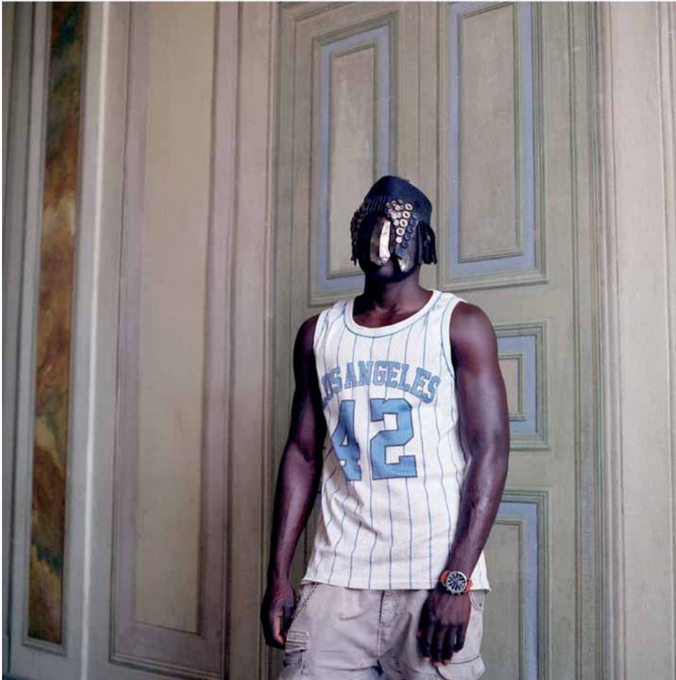
Sans titre, 50 x 50 cm, 2018