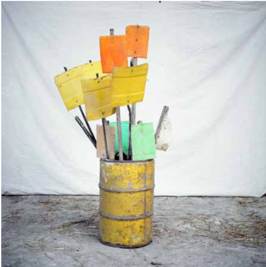
Le bouquet 2 x 2 m Wall paper - 2014