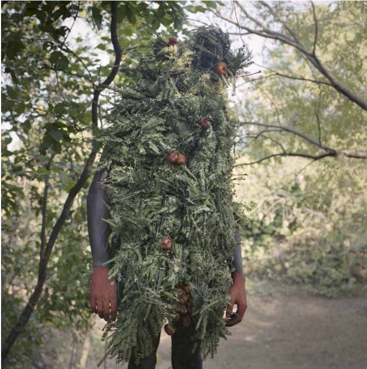
Sans titre, 1 x 1m, 2015