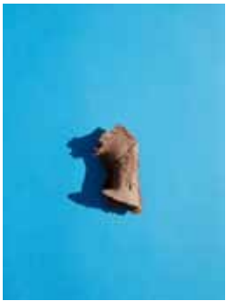
Bleu Charrette et Terre d'Ombrie 42 x 28 cm chaque 198 x 264 cm Wall paper - 2020