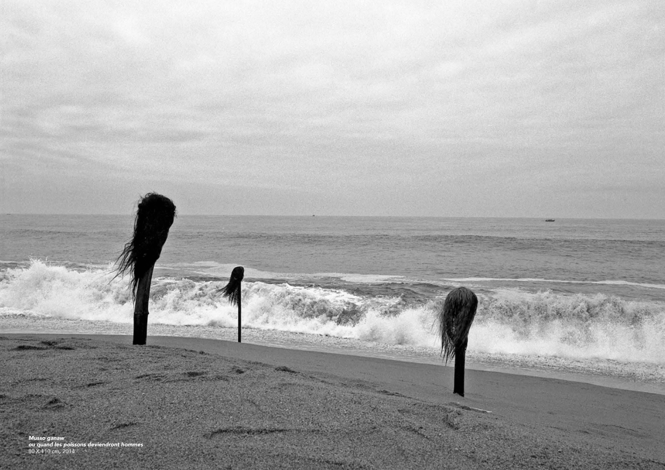
Musso ganaw ou quand les poissons deviendront hommes 80 X 110 cm, 2014