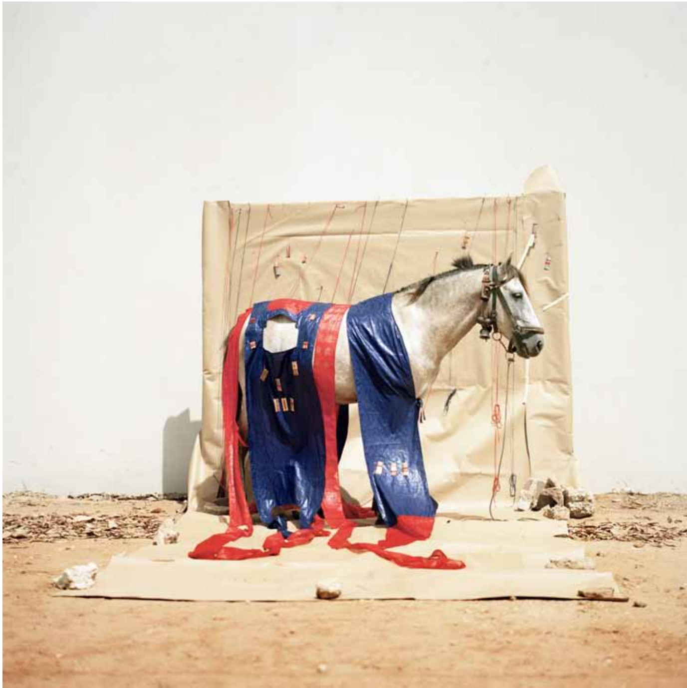
Daa, 80 x 80 cm 2015