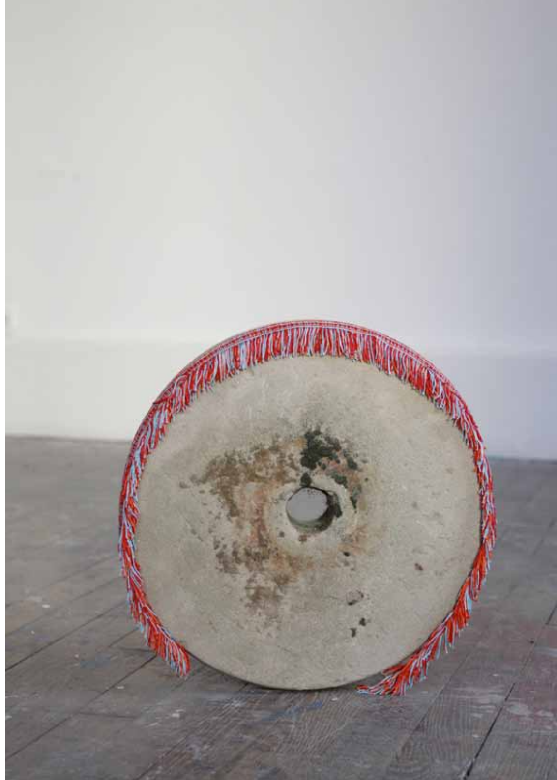
Rain drum Extrait de Tres surcos 30 cm de diamètre - 2018