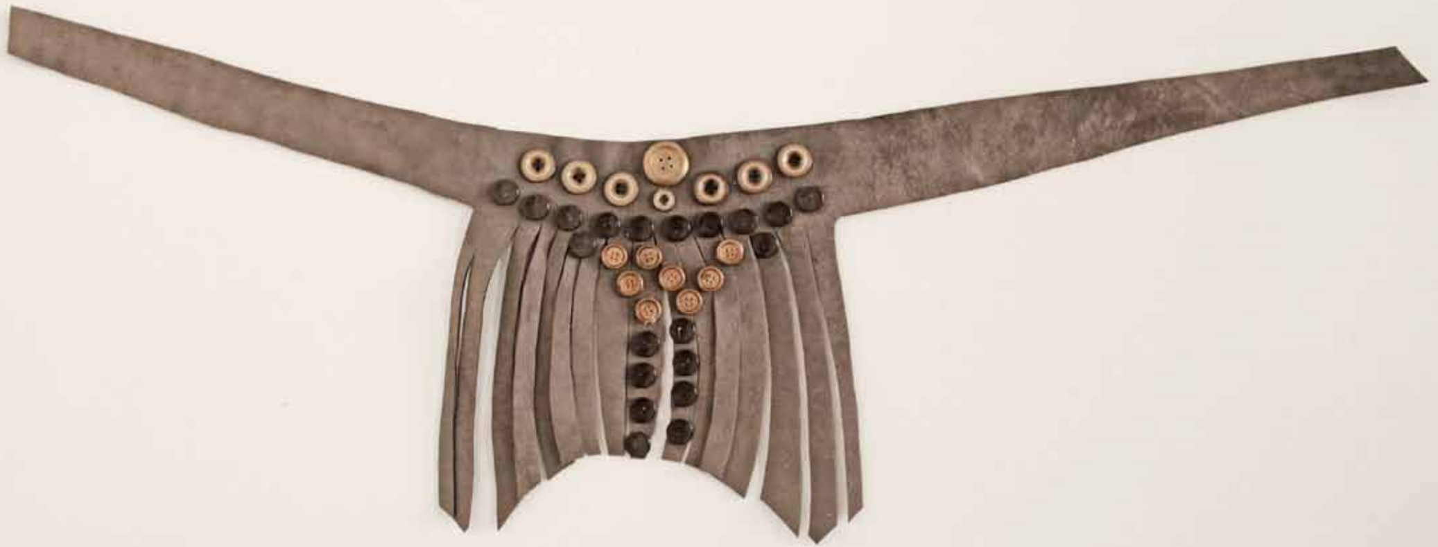
The arena in the arena détail 2018