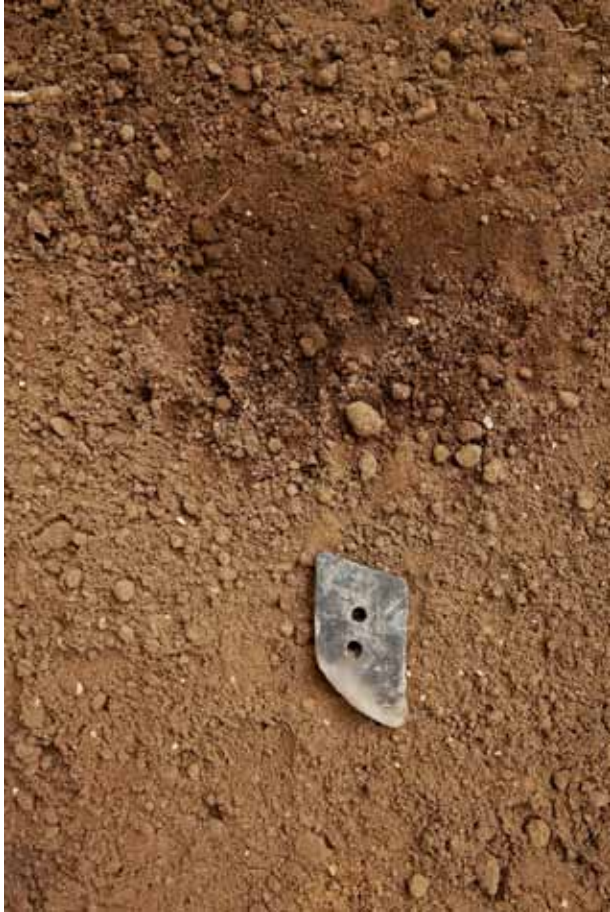
Outil à l'acte à semer 1 Céramique terre de la région de Jalisco.

Combinaison pour l'acte à semer 2 Voilette: impression photographique sur textile. Broderie avec cordes à nouer de sacs de semences.