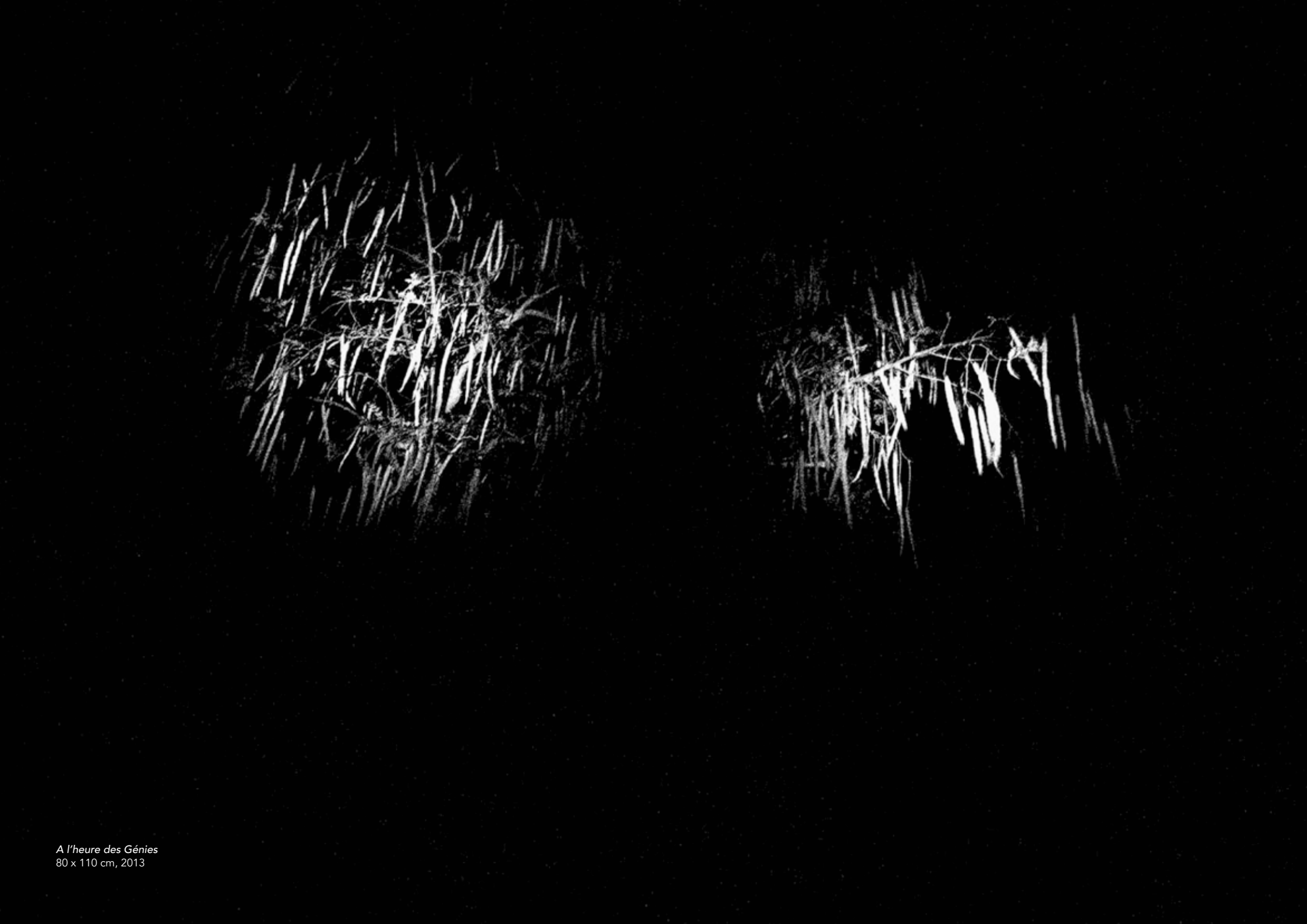
A l'heure des Génies 80 x 110 cm, 2013