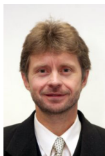
Jméno : RNDr. Miloš Vystrčil, ODS Funkce : hejtman Gesce : hejtman