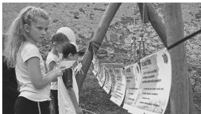
Klimatour 2018 – zastávka ve Starči